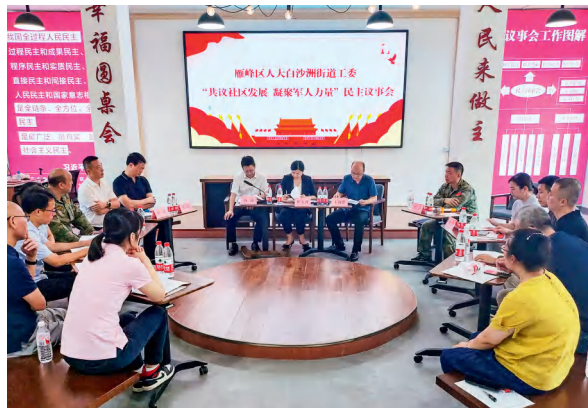
雁峰区人大常委会白沙洲街道工委开展“幸福圆桌会”民主议事活动。

年中，由区人大常委会领导及专委会、专业代表小组及人大代表组成的5个专题调研组，深入单位、企业、项目现场，开展“法治护企”“法治护绿”“法治护安”等专题活动，依法监督区“一府两院”主要目标任务“双过半”情况，监督推进滞后工作提速增效。