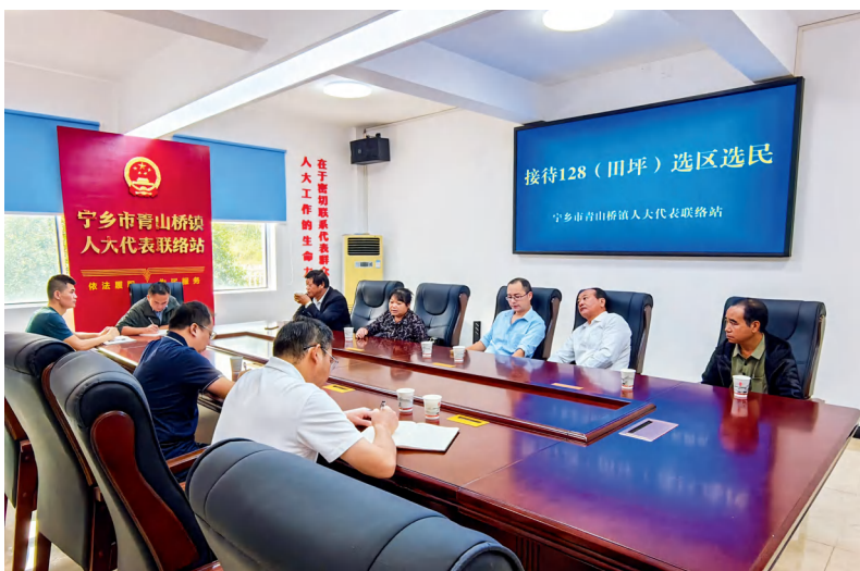
宁乡市部分人大代表在青山桥镇人大代表联络站集中接待选民，听取选民意见建议。

宁乡市人大常委会以深入推进代表联络站“建管用”为切入点，全力夯实全过程人民民主基层单元。