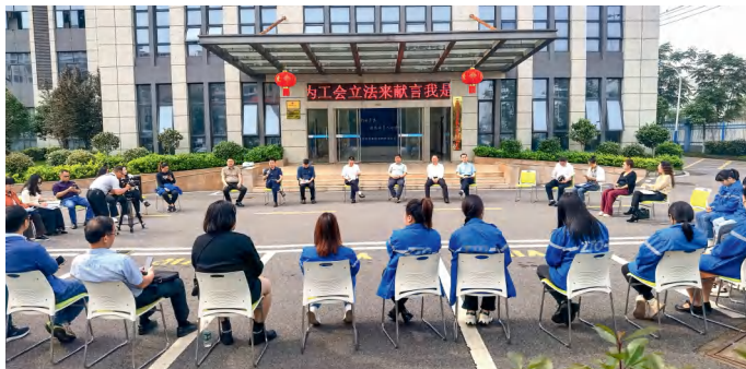
衡南县开展“我是会员，我为工会立法来献言”立法建议征集活动。

市人大常委会立足基层立法联系点“小阵地”，汇聚各方资源，发挥基层人才智力优势。在衡阳市平安村社区建设条例草案征集意见阶段，立法专班到衡南县车江街道恒星村征求人大代表、镇村干部和群众代表等各方意见。在参与《湖南省实施〈中华人民共和国法律援助法〉若干规定（草案·一审修改稿）》意见征询时，邀请参与法律援助的公益律师、基层法律服务工作者或群团组织负责人参加座谈，收集意见建议60余条。“群众的意见多是情感上的表达，大多关心法律法规好不好、管不管用、能不能有效地解决现实利益问题；相关领域专家、法律工作者，更倾向于文字表述的精确性和法条规定的可实施性。听取多方人士的意见，也是科学立法、民主立法的重要方面。”市人大常委会党组成