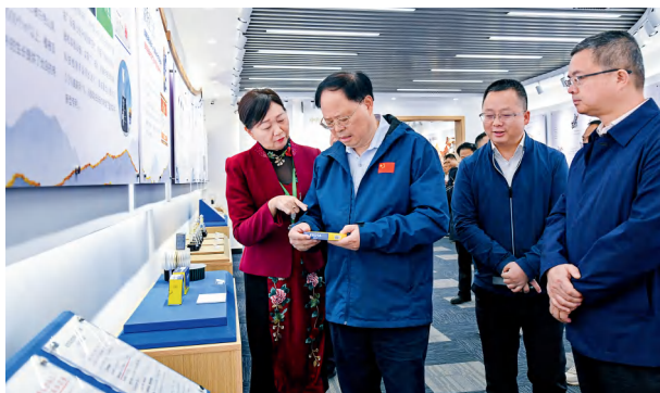
10月21日至23日，省人大常委会党组副书记、副主任张剑飞率执法检查组赴衡阳市、永州市开展执法检查。图为张剑飞在时代阳光药业实地检查。

9月20日，省人大常委会全面启动安全生产“三法一条例两办法”执法检查，作为“法治护安人大行”的重要行动。此次执法检查由省人大常委会主任会议（党组）成员带队赴省直部门及全省14个市州开展执法检查。