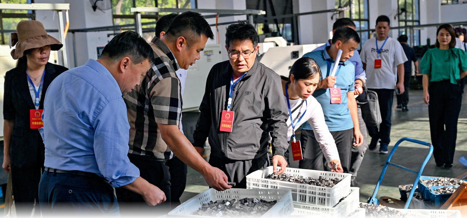
10月16日，辰溪县人大常委会组织省市县三级人大代表视察孝坪军民融合特色产业园工业项目。

港联动拓展辰溪湘西南铁路物流园、着力打造大湘西地区改革开放标志性工程的决议，制定了关于加强对县产业园区重点工作监督的实施方案，助推全县营商环境优化和怀化国际陆港辰溪港区建设，有力推动了县产业园区的建设发展。