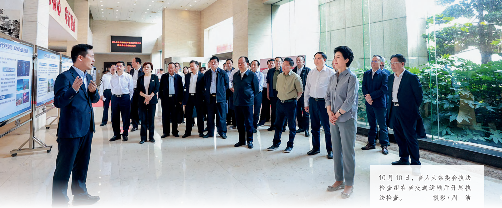
10月10日，省人大常委会执法检查组在省交通运输厅开展执法检查。