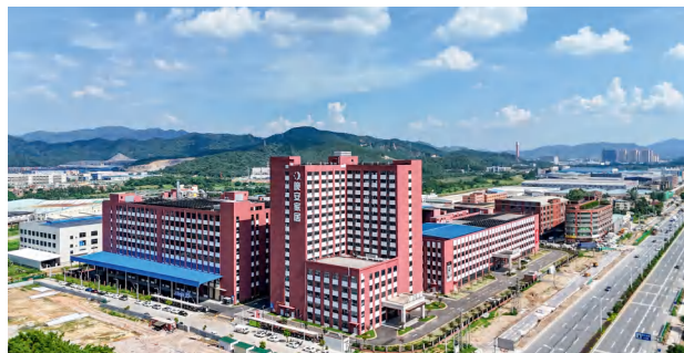
广东佛山-佛山晚安制造中心。

1986年，湖南省晚安家居实业有限公司（以下简称晚安家居）从长沙湘江边的小工棚启航，如今已发展成为一家集研发、生产、销售于一体的大型家居企业。近40年来，公司始终坚持企业发展与社会、人民需要紧密结合，品牌知名度、影响力和美誉度不断提升，积极担当为国家作贡献、为民族创品牌、为社会担责任、为行业树榜样、为员工谋幸福、让世界充满爱的使命，投身赈灾、助学、敬老爱老等公益事业，扶助品学兼优大学生近千人，捐助学校近20所，每年爱心公益捐赠1000余万元。