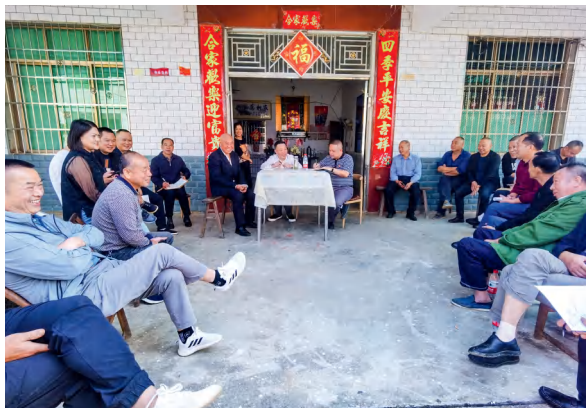
珠晖区人大常委会调研组在新华村召开屋场恳谈会，与群众面对面交流，听取群众意见。

项目票决通过后，区人大常委会迅速行动，将民生实事项目实施纳入年度重大事项监督计划，成立5个监督小组，按照“三单四图”创新模式，对项目进行全程跟踪监督。