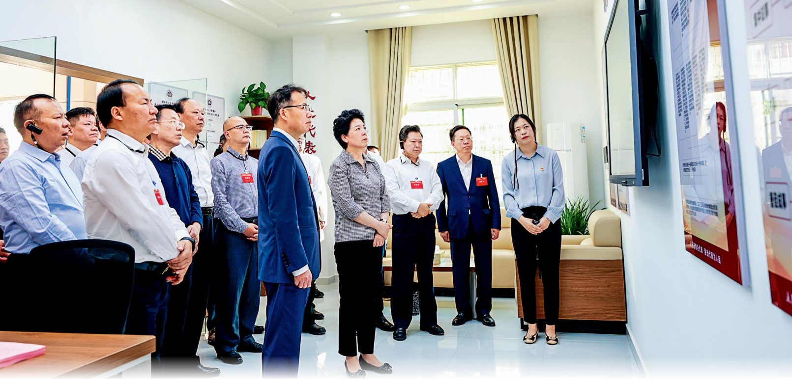
与会人员现场观摩湘乡市龙洞镇人大代表联络站“建管用”情况。