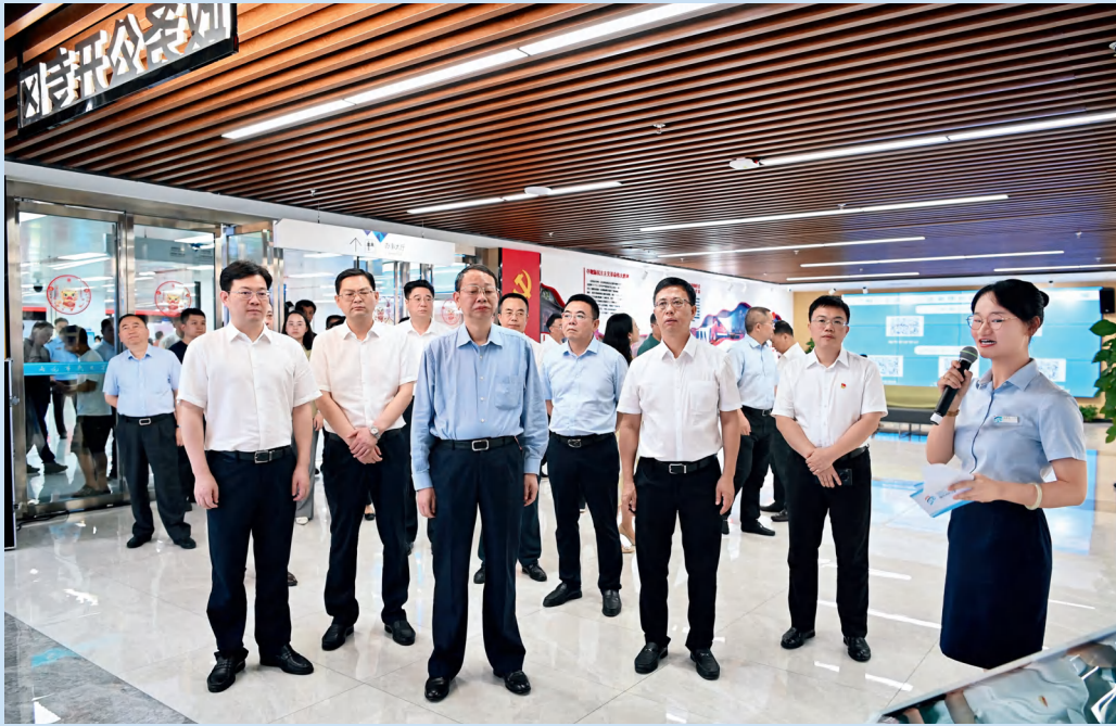
长沙市人大常委会主任文树勋带领市人大常委会主任会议成员就全市优化营商环境工作开展专题调研。