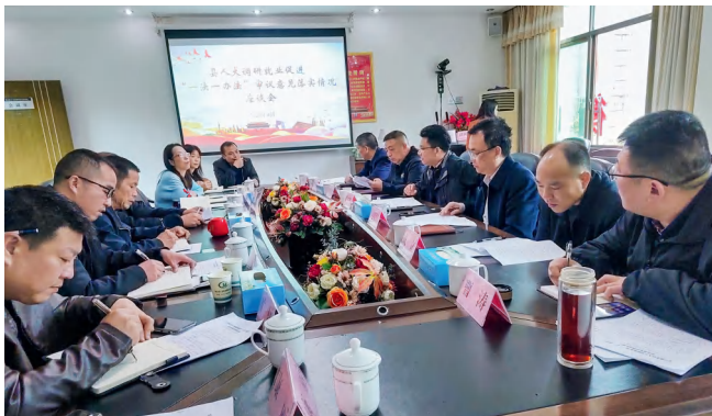
县人大常委会调研组召开就业促进“一法一办法”执法检查报告和审议意见落实情况座谈会。

对清单落实情况进行跟踪督办，是推动问题得到有效解决、增强监督实效的重要手段。审议意见明确的问题，由县人大相关专门委员会拟定督办计划表，让督办工作有序开展：审议意见印发三个月后询问工作进展情况，并跟踪办理进度；半年内政府相关部门书面汇报落实情况，专门委员会对落实情况进行核查；对落实情况不理想的，开展专项调查和督导，督促承办部门采取有效措施确保一年内落实到位。整个督办过程脉络清晰、有章可循，三个阶段环环相扣、步步推进，让审议意见件件触底，步步落实。如为全面了解县人大常委会关于就业促进“一法一办法”执法检查报告的审议意见落实情况，县人大社会建设委牵头制定具体督办方案，围绕审议意见中提出的4个主要问题落实情况开展调研并向主任会议汇报，对已完全落实的3个问题销号，对产教