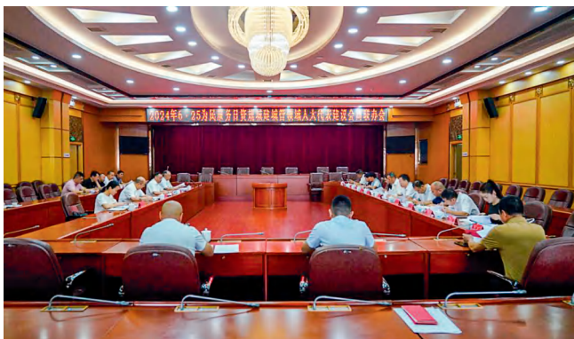
衡阳市人大常委会召开城建城管领域代表建议会商联办会。