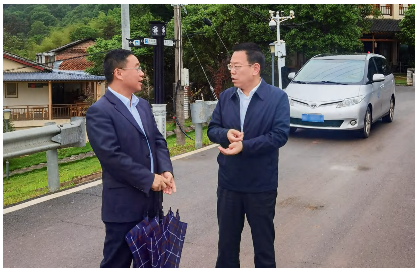
衡阳市人大常委会主任刘正兴（右）调研代表建议办理情况。

为督促办理好人大代表提出的建议，提高问题的解决率，今年以来，衡阳市人大常委会首次对办理结果为B类（即所提问题正在解决或列入规划逐步解决）的建议进行第二次交办，首次采取“会商联办”的形式对代表建议进行重点督办，取得了较好的效果。