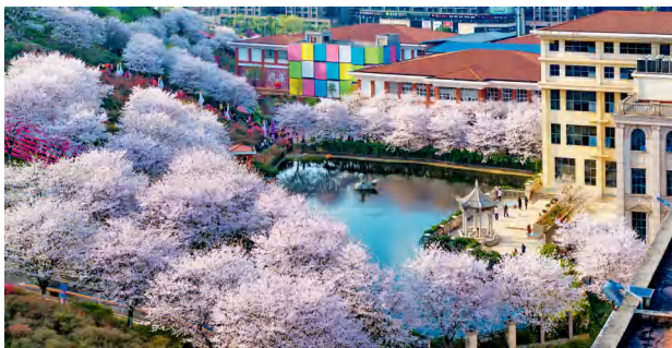
湖南长沙-晚安家居文化园。