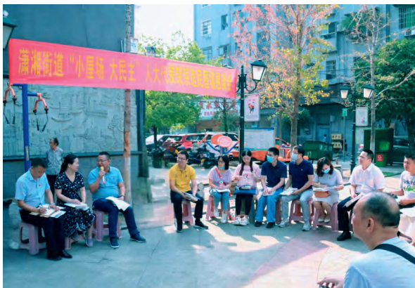
石鼓区人大常委会潇湘街道工委组织部分区人大代表通过民情恳谈会征集群众“心愿”。

“我认领解决草后街小区内涝和排污问题的心愿。”“我认领完善五网格小区配套设施的心愿。”……9月13日上午，在衡阳市石鼓区五一街道会议室里，15名市区两级人大代表从五一街道人大工委主任手中郑重接过满载群众诉求的“心愿清单”，他们望着墙上写着“为民造福，惠民利民”的鲜红锦旗，眼中满是坚定，“群众的‘心愿清单’就是我们的‘履职答卷’，我们一定交出让人民满意的答卷”。