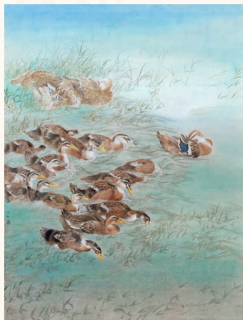
《十八洞乡情——水暖争春华》180cm×140cm