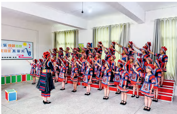
音乐教师在塔山瑶族乡狮园完小指导学生合唱。

今年9月以来，常宁市教育领域专业代表小组与市教育局联合开展了为期一个月的公益音乐课堂支教活动，选派音乐教师41人，覆盖23所乡村学校，为836名儿童带去了不一样的音乐合唱课。这是常宁市人大常委会开展关爱留守儿童，助推“五育并举”活动的一个缩影。