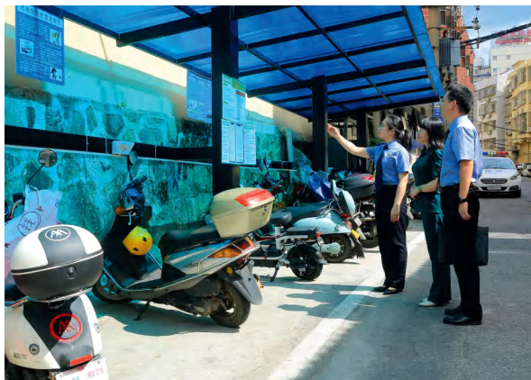
浏阳市人民检察院邀请人大代表开展“飞线充电”专项督查。

进一步监督支持市人民检察院开展公益诉讼工作的决议，建立了定期报告、线索反馈、公益诉讼座谈会等制度，对“人大+检察”联动监督进行了有益探索。