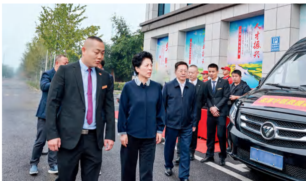
10月28日，省人大常委会党组书记、副主任乌兰带队在湘潭市中心医院实地检查医院安全生产监管情况。