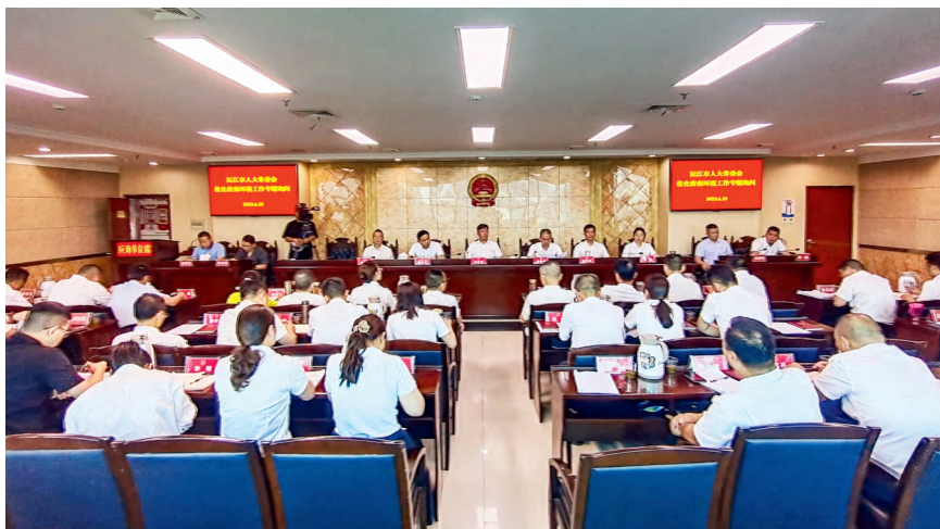
2023年6月25日，沅江市人大常委会举行首场专题询问会议。

选题确定后，紧接着就是确定应询单位。根据2022年省优化营商环境考评结果，市民政局、市城管执法局、市人民法院、市自然资源局、市市场监督管理局5个单位在2022年营商环境省评中，失分较多，相对而言，存在的问题较多，工作提升的空间较大。经市