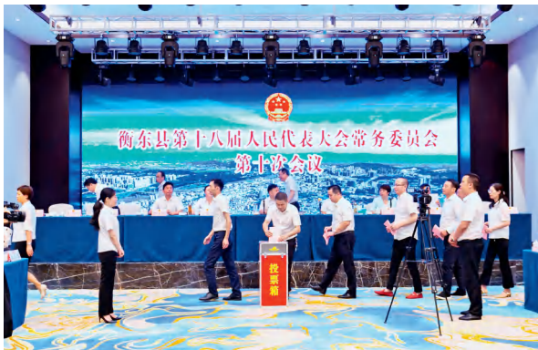
衡东县十八届人大常委会第十次会议对优化营商环境专项工作开展满意度测评。

衡东县人大常委会在优化营商环境、代表代访带访、培育和壮大代表创客的实践中，充分发挥代表作用，促进代表履职尽责，助力县域经济社会高质量发展。