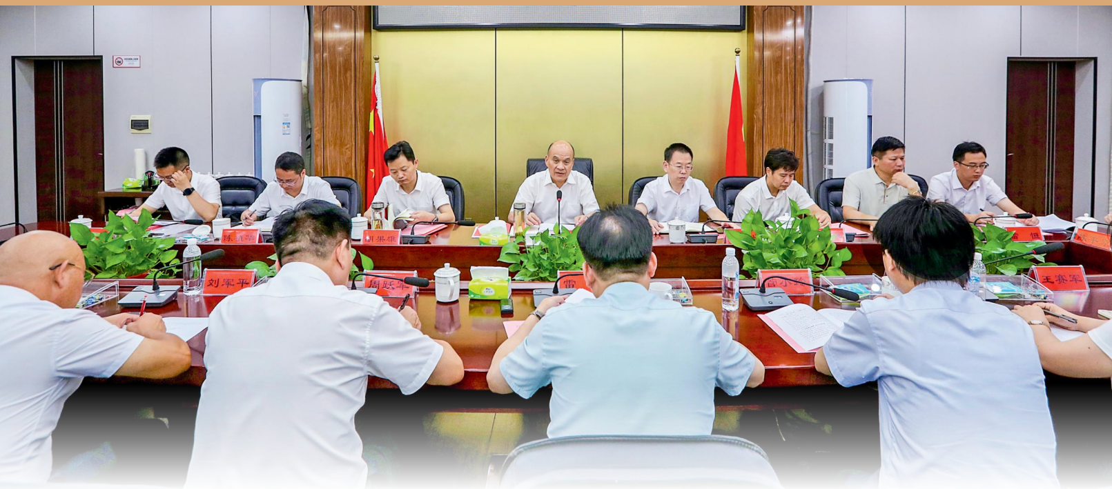
衡阳市委书记刘越高（后排左四）、衡阳市人大常委会主任刘正兴（后排右四）以市人大代表身份在祁东县参加代表小组活动。