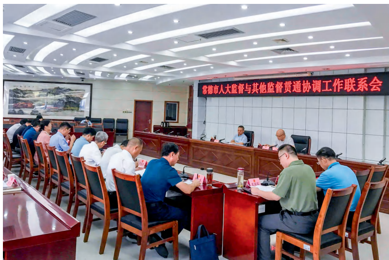
9月3日，常德市人大监督与其他监督贯通协调工作联系会召开。

7月，《常德市人大监督与其他监督贯通协调工作机制（试行）》（以下简称《工作机制》）经市人大常委会