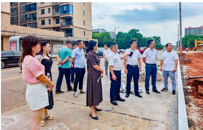
衡南县人大云集街道工委组织市、县人大代表到旺华路施工现场督查。

在4个部门的配合下，代表们再次进行了视察调研，并于2024年7月9日向市人大常委会提交了调研报告，市人大常委会立即转交给县政府处理落实。县政府高度重视，当天下午县政府办公室牵头，组织县住建局、县城管执法局、县交警大队等单位负责人召开会议研究，安排工作任务，明确工作责任，要求2024年底