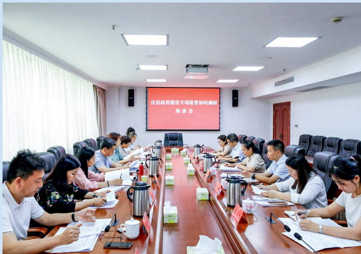
岳阳市人大常委会调研组召开法治政府建设专项监督协同调研座谈会。

党委高度重视，统领有力。省委副书记、岳阳市委书记谢卫江审定，将法治政府建设监督作为市人大常委会年度重点工作之一。9月5日，市委常委会会议听取市人大常委会关于法治政府建设监督工作情况汇报，点评满意度测评结果，强调要正确对待人大监督，深刻认