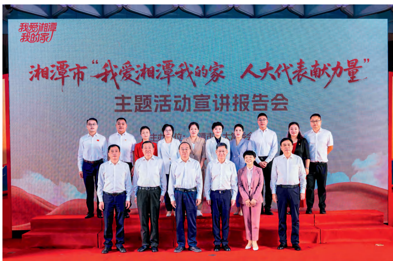
9月22日，湘潭市人大常委会领导参加“我爱湘潭我的家 人大代表献力量”主题活动宣讲报告会。