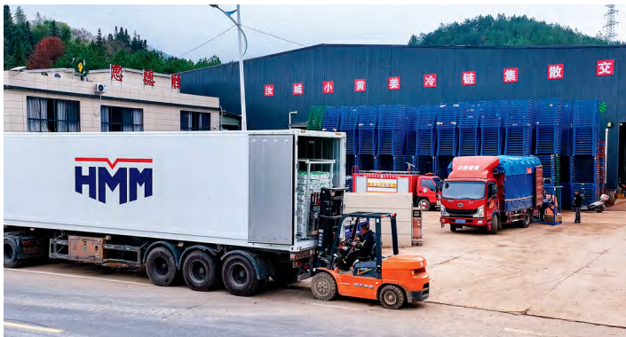
汝城小黄姜整装待发运往阿联酋迪拜。