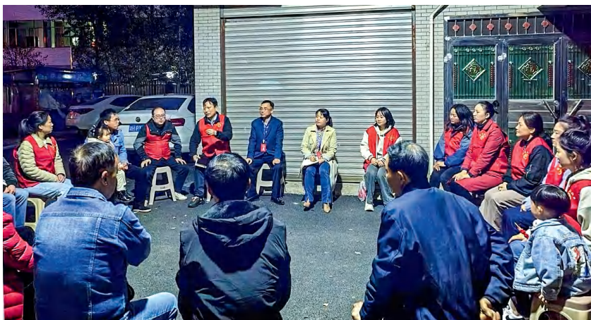
益阳市资阳区居民议事员在闭会期间开展议事活动。