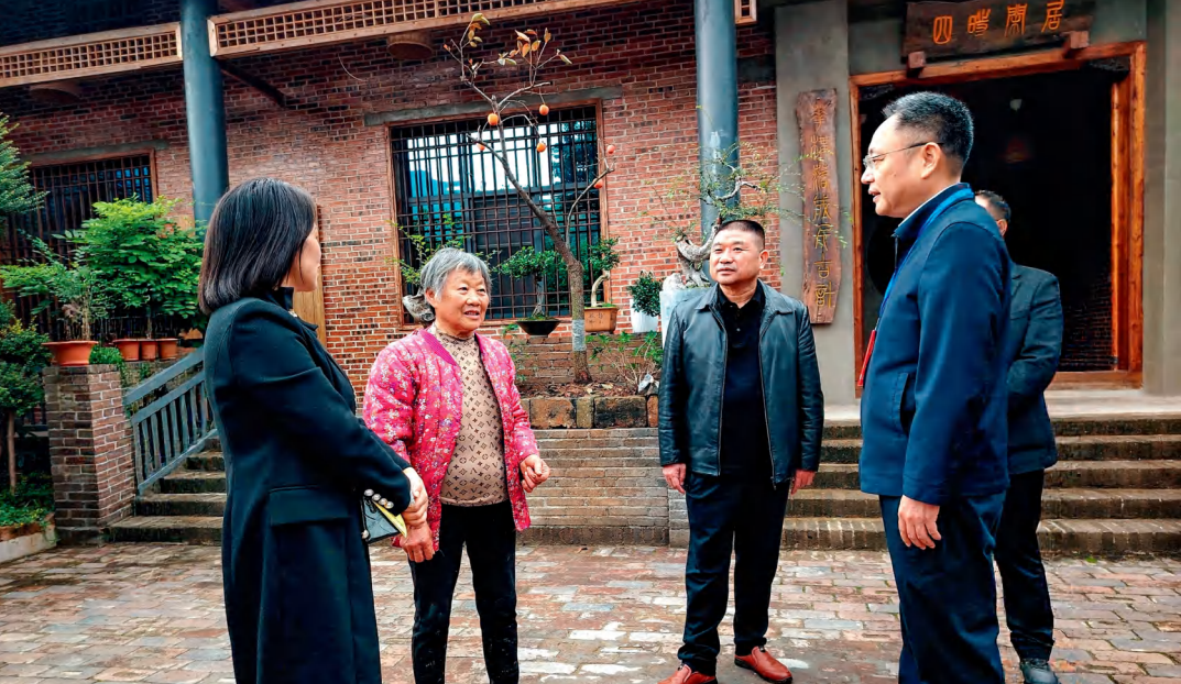
双峰县杏子铺镇人大代表调研文旅融合民宿发展情况。