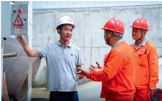
省应急管理厅开展“送课上企”，专家到企业面对面解难题、手把手教方法。