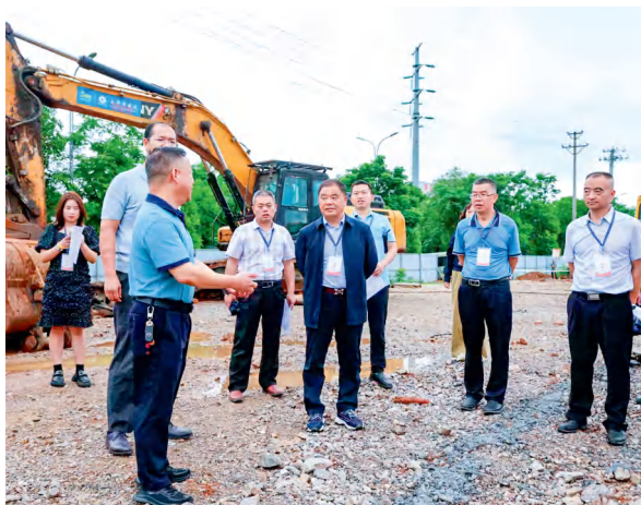
6月26日，花垣县人大常委会调研组在县产业园区晋道环保科技有限公司调研。

立法先行，为治理筑牢制度根基。3月1日，全国首部规范县域矿山生态修复的地方性法规——《湘西土家族苗族自治州花垣县矿山生态修复条例》（以下简称条例）正式施行，标志着“锰三角”治理迈入法治化新阶段。这部历经调研起草、听证论证、多轮审议的法规，用12条刚性条款明确修复责任，破解“企业污染、群众受害、政府买单”的困局，更创新性地为尾矿渣资源化利用“开绿灯”，让昔日废弃物变废为宝。6月19日，花垣县十八届人大六次会议表决通过了关于“锰三角”矿业污染综合整治工作报告的决议，举全县之力推