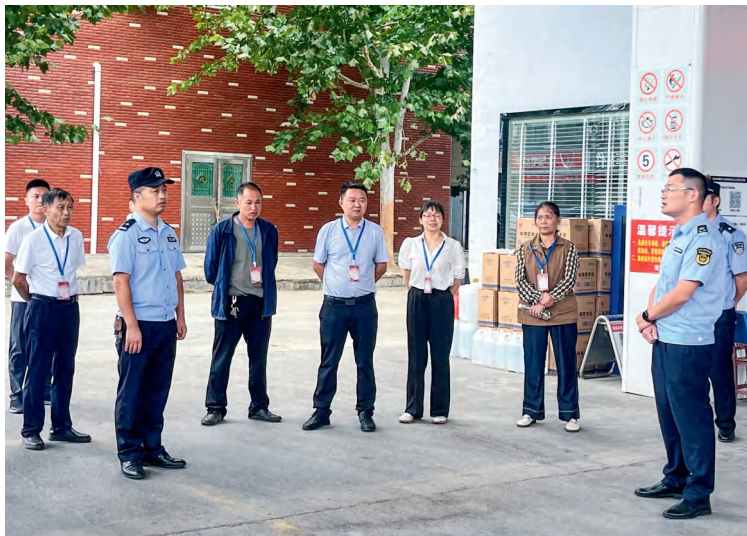
宁乡市流沙河镇人大代表深入一线开展执法检查。

流沙河镇人大主席团将继续深化履职创新，不断完善闭环工作体系，努力在推进基层治理体系和治理能力现代化中贡献更多人大力量，让民主实践在乡村一线焕发勃勃生机。■