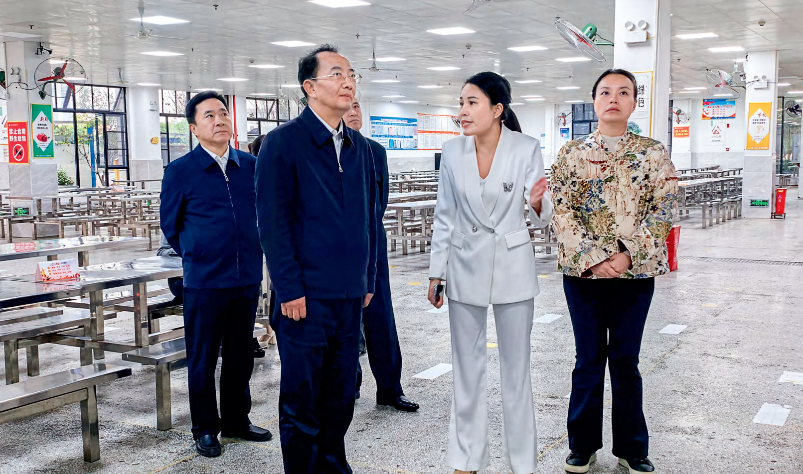
10月22日，省人大常委会党组副书记、副主任杨浩东率执法检查组在永州市冷水滩区银象小学开展安全生产“三法一条例两办法”执法检查。