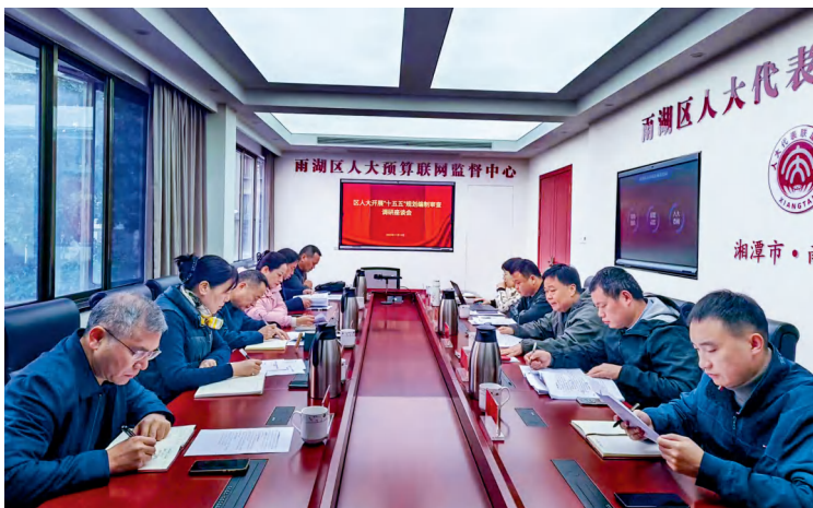
湘潭市雨湖区人大常委会召开“十五五”规划编制审查调研座谈会。

针对审计查出问题整改“重形式、轻实效”的顽疾，区人大常委会创新报告形式，首次要求审计发现突