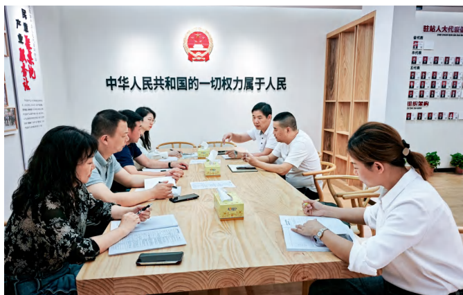
株洲市芦淞服饰产业人大代表联络站开展“倾听民意，健康护航”主题接待活动。

11月5日，株洲市芦淞服饰产业人大代表联络站联合建宁街道举办“人大代表搭桥梁 金秋职遇促就业”专场招聘会。驻站代表利用行业资源和经验，开展“代表荐岗”，进行专业指导，吸引了大量求职者踊跃参与。此次活动是芦淞服饰产业人大代表联络站开展主题活动的生动实践。