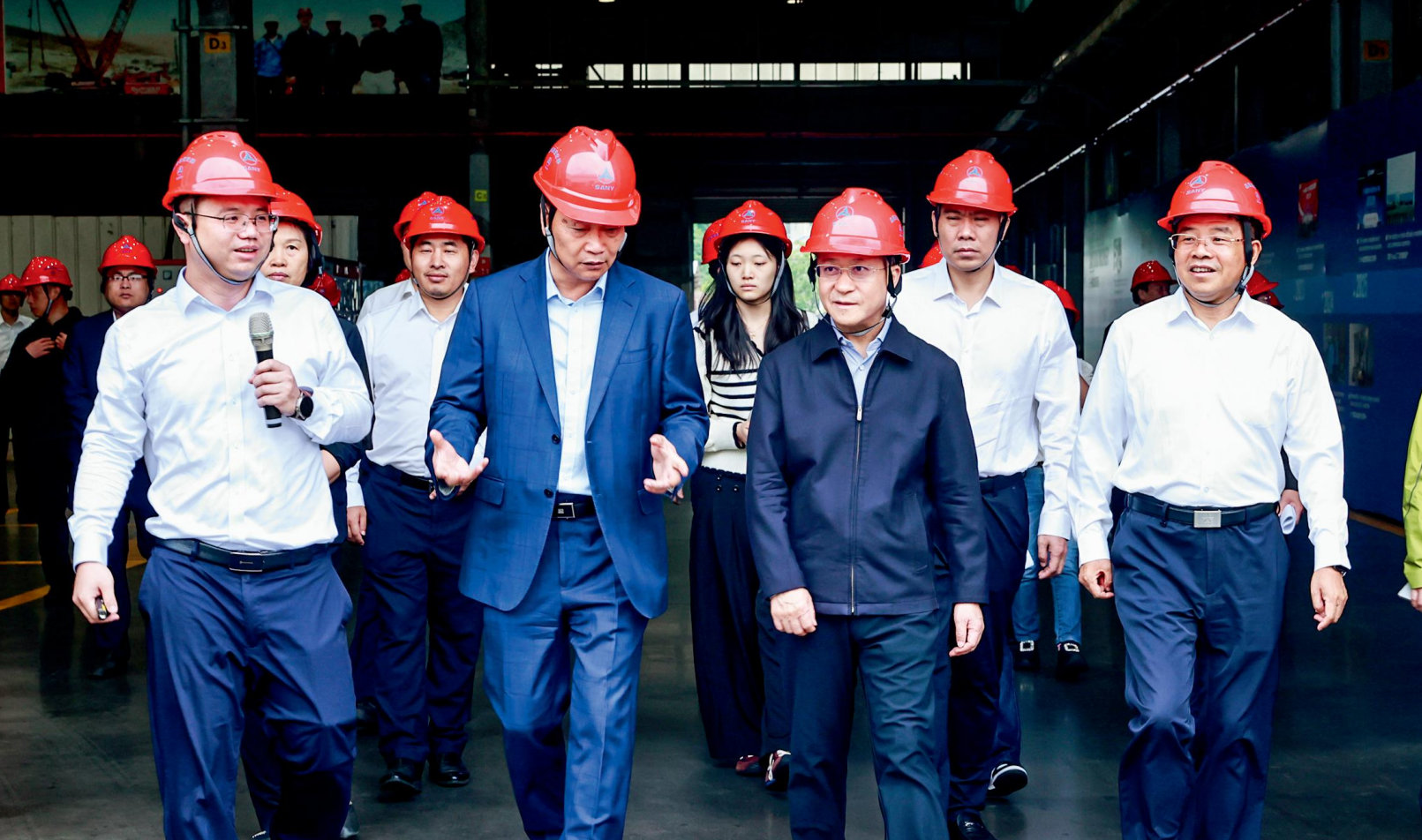
10月14日，省人大常委会副主任胡旭晟率安全生产“三法一条例两办法”执法检查组在娄底开展执法检查。图为执法检查组在娄底市中源新材料有限公司检查。

责任要求，每一个主体都有不可推卸的法律责任。”如何让法律法规条文转化为基层一线的实际行动，打通责任落实的“最后一公里”，是省人大常委会组成人员审议的焦点。