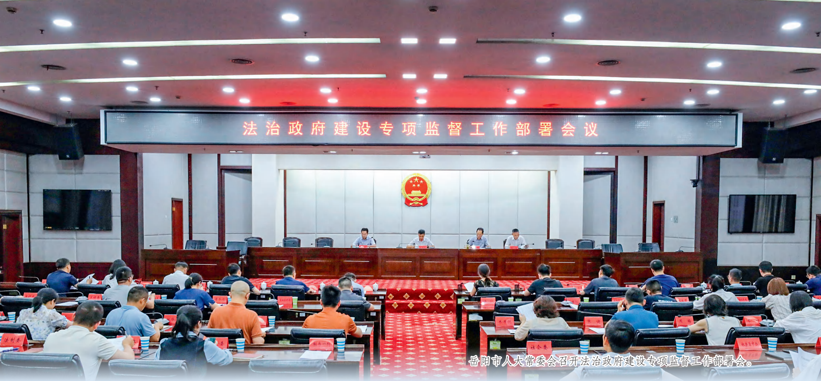
岳阳市人大常委会召开法治政府建设专项监督工作部署会。