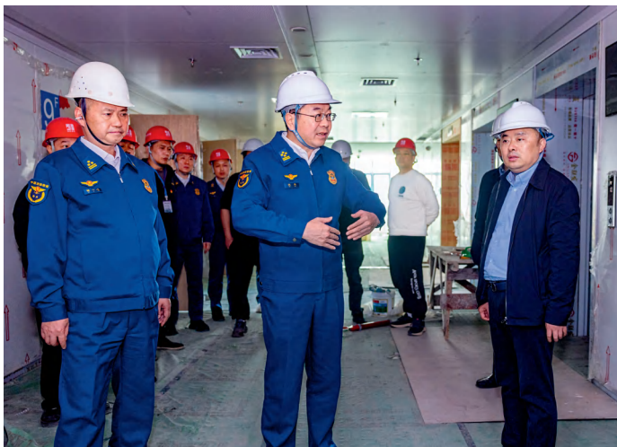
湖南省消防救援总队总队长谈迅检查在建工地消防安全工作。

群众幸福值作为工作的出发点和落脚点，提请省政府将消防安全纳入全省民生实事重点清单，将新建150个消防站，为37万特困家庭装感烟报警器，建设电动自行车、电动摩托车充电端口5万个，开展“三湘怡养提升行动”4项任务列入2025年全省十大民生实事。同步强化应急救援能力，今年以来，全省消防救援队伍处置各类任务6.15万起，营救疏散群众7747人，抢救财产11.77亿元，成功处置怀化沅陵“2·25”沉船事故、常德临澧“6·16”烟花爆炸事故、6月湘西北抗洪抢险、资兴“7·5”船只侧翻事故等重大任务，民生保障成效获人民群众充分肯定。