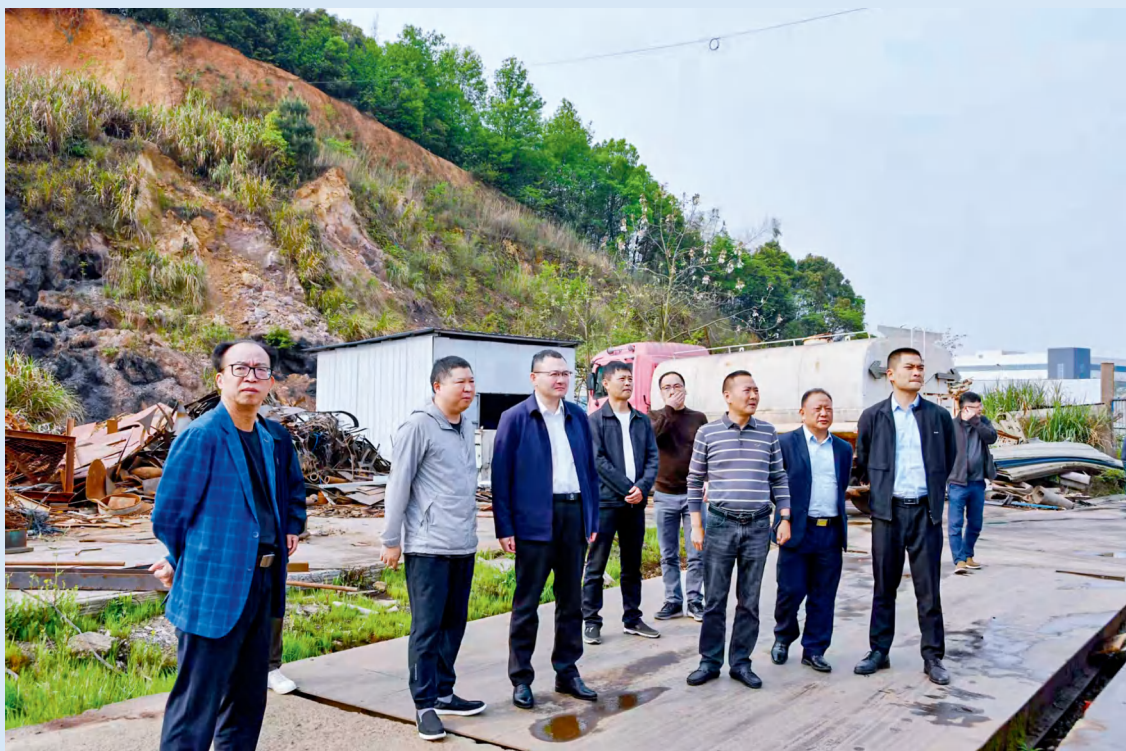
2025年4月，岳塘区人大常委会开展2024年度全区环境状况和环境保护目标完成情况调研视察。

2025年，湘潭市岳塘区人大常委会坚持围绕中心、服务大局、突出重点，综合运用法定监督方式，实行正确监督、有效监督、依法监督，以高质效监督助推全区经济社会高质量发展。