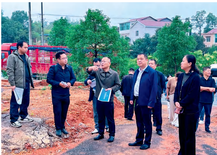
株洲市渌口区人大常委会组成人员视察南洲镇自建房情况。