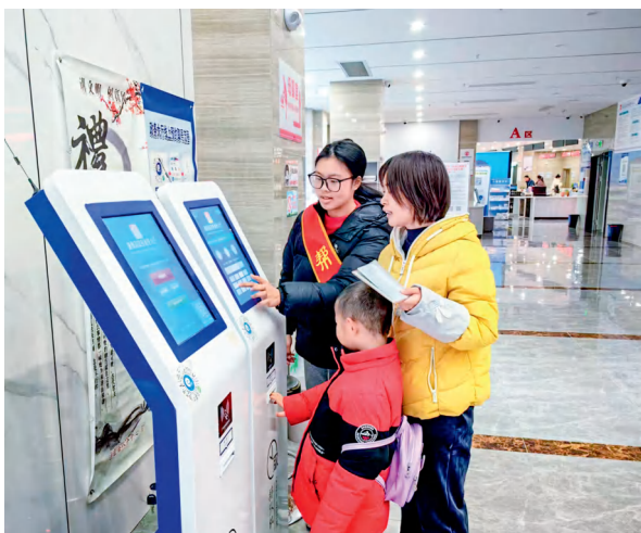
通道侗族自治县政务大厅导询帮代办。

营商环境是区域发展核心竞争力，是贯彻新发展理念、构建新发展格局的基础支撑。通道侗族自治县是湖南省成立最早的少数民族自治县，总人口24.17万人，其中少数民族人口占比达88.1%。近年来，通道侗族自治县牢记习近平总书记“营商环境只有更好，没有最好”的殷殷嘱托，以优化程序、优质服务、优良作风“三优”改革为牵引，推进政府职能转变与服务效能提升，探索出一条具有民族地区特色的营商环境优化路径，为县域经济高质量发展注入内生动力，2024年通道侗族自治县入选“湖南省营商环境评价表现优秀地区”。