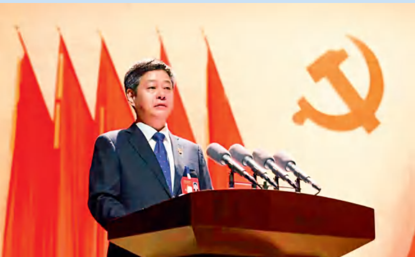
邵阳市委书记严华作邵阳市第十二次党代会报告。