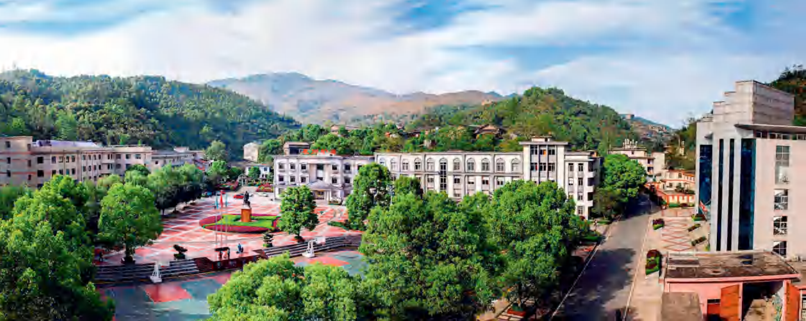
辰州矿业公司主楼。

建设，党委领导核心和政治核心作用、党支部战斗堡垒作用和党员先锋模范作用有效发挥。坚持党建与生产经营深度融合，紧跟企业提质转型升级步伐，着力将辰州矿业打造成为矿山行业的“领军企业”和“行业标杆”，打造成为地方经济建设发展的“主力军”和“先锋队”。坚持党建文化引领企业文化建设，打造“认同辰州、奉献辰州、创造辰州”的核心文化理念，形成了“热情淳朴、吃苦耐劳、开放包容、革故鼎新”特色矿山企业文化，涌现出了一大批“爱岗敬业、诚实劳动”的先进模范人物。