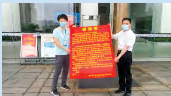
园区企业感谢株洲高新区产业发展局工作人员在疫情防控期间的辛勤付出。

服务水平不断提升。认真落实惠企政策，2021年兑现工业类企业奖补资金5000余万元，将真抓实干表彰、创新型县（市、区）建设等上级奖励资金600万元全额