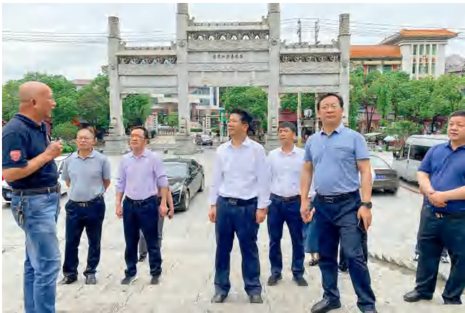
2021年5月，省人大常委会研究室党支部赴茶陵县开展党史学习教育第三专题“学史崇德”主题党日活动。

省人大常委会研究室深挖人大制度理论和实践“富矿”，深钻细研、深入浅出，努力推出一批有思想性、有穿透力、有含金量的精品力作，着力提升人大理论和实践研究水平。