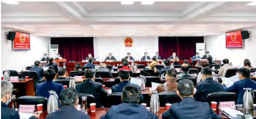
2021年10月28日，张家界市七届人大常委会第三十九次会议传达学习中央人大工作会议精神。

张家界市人大常委会锚定“四个机关”建设新定位，为坚持和完善人民代表大会制度，做好新时代人大工作描绘了新坐标。