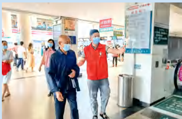
志愿者为门诊患者提供导医服务。