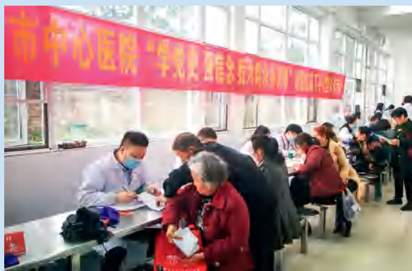
医院组织医务工作者开展送医送药下乡义诊活动。