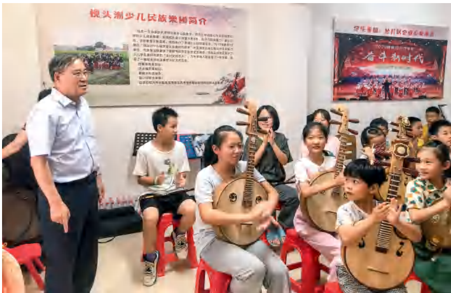
2020年7月，省人大教科文史调研组在株洲市开展加强乡村文化建设助推乡村振兴专题调研。

聚焦新使命新要求新任务，高举旗帜、紧跟核心，干在实处、走在前列，以法治方式助力高质量发展，推动我省教科文史事业再上新台阶。