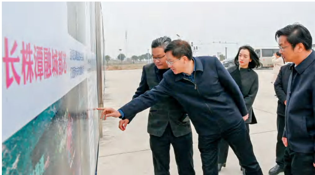
2021年12月8日，长沙市人大常委会党组书记、主任谢卫东率市人大常委会主任会议成员在天心区调研，推进长株潭一体化建设工作。

长沙市人大常委会把全面深入学习贯彻习近平总书记重要讲话精神和中央人大工作会议精神作为当前的重要政治任务，奋发履职、积极作为，以实际工作成效担当起新时代赋予人大工作的历史使命。