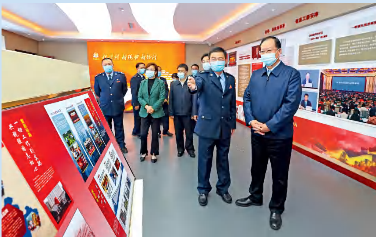
省人民政府主要领导在省税务局调研。

2021年，湖南税务系统坚持以习近平新时代中国特色社会主义思想为指导，以开展党史学习教育、深化税收征管改革、服务“三高四新”战略定位和使命任务为重点，攻坚克难、砥砺奋进，高质量推进新发展阶段税收现代化建设，为大力实施“三高四新”战略定位和使命任务、奋力建设现代化新湖南贡献税务力量。2021年，全省税务系统组织各项收入超过6000亿元，其中税收收入逾4500亿元。省税务局连续三年在省委、省人民政府绩效考评中名列中央驻湘单位第一名。