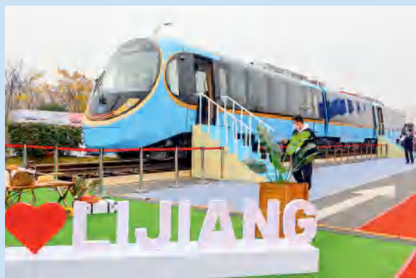
2021年12月，园区企业中车株洲电力机车有限公司为云南丽江定制的全球首列全景观光山地旅游列车在2021年中国国际轨道交通和装备制造产业博览会上首发。

用于扶持园区企业科技成果转化、核心关键技术攻关。在2021年7月至8月疫情防控战斗中，全局干部职工深入企业，熬夜奋战保安全、保生产，为园区企业提供核酸检测上门服务，开设检测专场50余次，累计完成采样74829人次，并积极协调打通北汽株分等企业的物流通道，打赢了疫情阻击战，获得园区企业的一致好评。