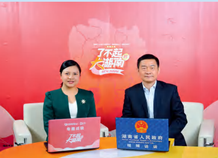
省税务局党委书记、局长刘明权（右）宣讲税收政策。

法治税务建设提质增效。 贯彻落实中办、国办《关于进一步深化税收征管改革的意见》，以及省委办公厅、省人民政府办公厅印发的《关于进一步深化税收征管改革的实施方案》和税务总局的工作部署要求，扎实推进税收征管改革，持续提升税收法治成效。一是税政管理质效不断提升。企业所得税核定征收、个人所得税综合所得首次年度汇算、资源和环境税收管理等工作高质量推进，契税法 and 城建税法顺利实施，税务“区块链+不动产交易”应用成功试点运行。二是税务执法方式不断优化。全面实施行政执法三项制度，落实10项“首违不罚”清单，推行6项税务证明事项告知承诺制度，建立不动产司法拍卖涉税征管联动机制。加强税收执法重点风险核查，追究责任411人次，开展3轮现金税费征缴实地督察，追究执法责任113人次。三是税收法治教育不断加强。落实“谁执法谁普法”责任制，税法进校园、行业学法考法、宪法宣传周等税收普法工作亮点突出，省税务局获评省直国家机关落实“谁执法谁普法”普法责任制考评优秀单位。