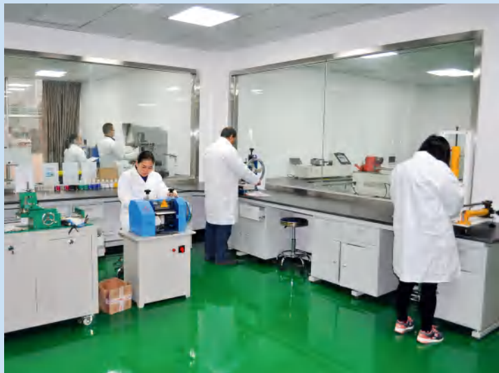
湘鹤电缆技术中心。