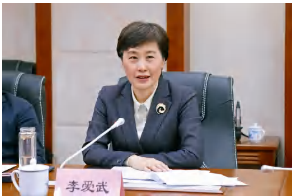
岳阳市市委副书记、市长李爱武。

岳阳市人大常委会以习近平法治思想、习近平总书记关于坚持和完善人民代表大会制度的重要思想为指导，乘势中央人大工作会议东风，强化责任分解，推动落地落实，在立法、监督、代表工作以及自身建设上勇于创新，为“三高四新”战略定位和使命任务实施、加快“三区一中心”建设贡献人大智慧和力量。