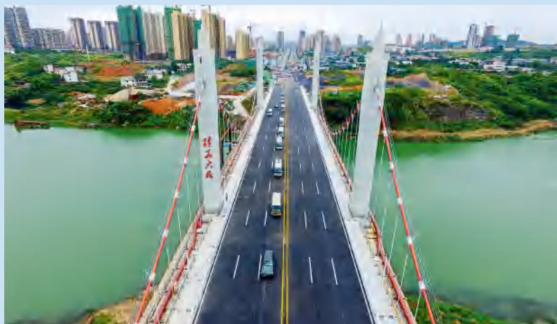
邵阳路桥承建的市政精品——桂花大桥（该项目部被评为“全国工人先锋号”）。

业”“湖南省质量管理先进单位”“湖南省十佳学习型组织”等殊荣。2012 年来，公司连续 9 年获得湖南公路施工企业信用评价最高级 AA 级，多次获评交通运输部公路施工企业全国综合信用评价最高级 AA 级。