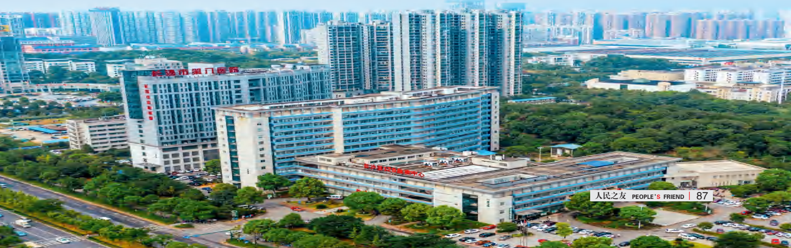
长沙市中医医院星沙院区全景。