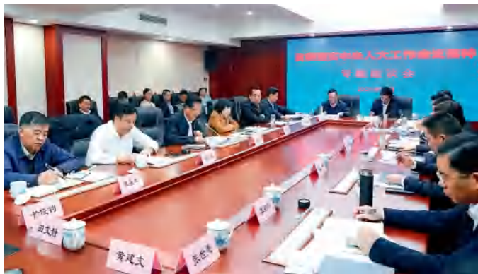
岳阳市人大常委会、市人民政府召开贯彻落实中央人大工作会议精神专题座谈会。

习近平总书记在中央人大工作会议上的重要讲话，为推进新时代人大工作和建设指明了前进方向、提供了根本遵循。我们要抢抓机遇、学深悟透、抓好落实，以更高政治站位、更强政治担当、更实思路举措，确保会议精神融入履职全过程，推动人民代表大会制度在岳阳的生动实践，推动全市人大工作再上新台阶。