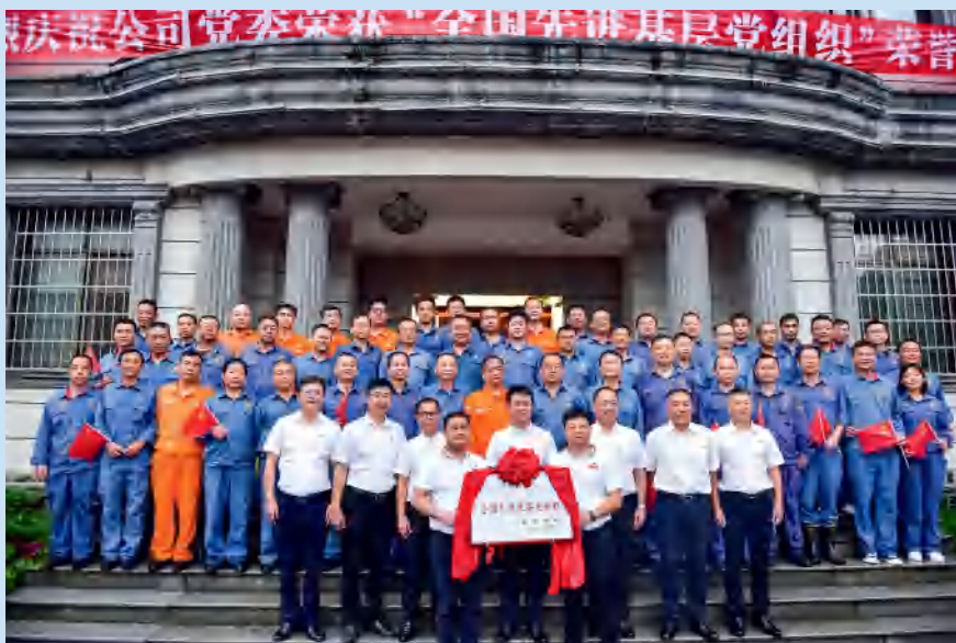
辰州矿业喜迎“全国先进基层党组织”荣誉。

站在新的历史起点上，辰州矿业将坚持“矿业为主、资源为重、安全为基、效益为上”的新发展理念，紧紧围绕湖南黄金集团“湖南省矿业核心平台，黄金为支柱，锑为特色的领先矿业集团”的战略定位和“双十目标”，勇毅前行，拼搏奋进，力争实现“自产黄金4吨，利润4亿，锑品行业单项第一”的“十四五”宏伟目标。