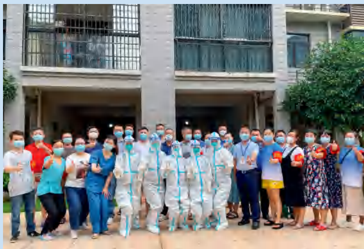
医院核酸采集小分队为社区居民服务。