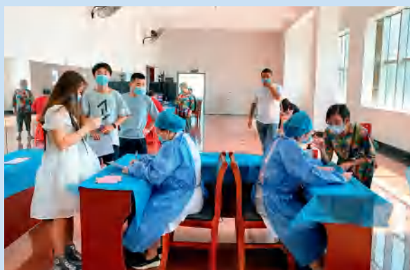
娄底市中心医院牵头承办娄底宾馆新冠肺炎疫苗接种点。

大行德广，医惠众生。站在新的历史起点上，娄底市中心医院乘着新时代的浩荡东风，深怀福泽大众的美好愿景，将为医疗事业续写新的华彩篇章。