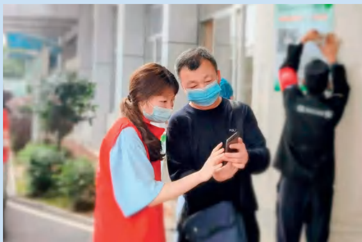
医院开展志愿者服务。

医院推行优质护理，提倡微笑服务，外树形象，从细微处让患者感受到医院为其着想的满满真情。