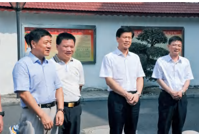
省人大监察和司法委调研组在常德市调研员额法官检察官履职评议工作。

省人大监察和司法委深入学习领会贯彻中央、省委人大工作会议精神，紧紧抓住新时代人大监察和司法工作“为谁干、干什么、怎么干”三大问题，广泛凝聚奋进力量，奋力谱写新时代人大监察和司法工作新篇章。