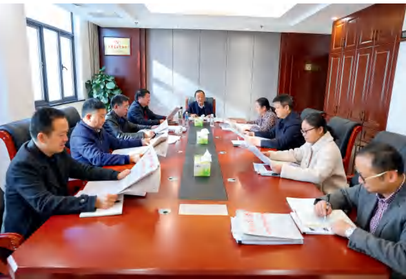
省人大社会委集体学习有关会议精神。

2022年是首届省人大社会委的收官之年，要坚持以习近平新时代中国特色社会主义思想为指导，坚持以人民为中心，锚定共同富裕目标，致力推进全过程人民民主，在发展中保障和改善民生，忠诚履职、铁肩担当，以优异成绩迎接党的二十大胜利召开。