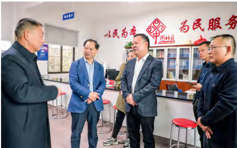
2021年10月20日，株洲市人大常委会党组书记、时任主任提名人选、现任主任刘光跃（左二）在渌口区调研代表工作室建设工作。

株洲市人大常委会坚定坚持党对人大工作的全面领导，深刻领悟以人民为中心的发展思想，紧紧牵住“四个机关”这一“牛鼻子”，守正创新，推动全市各级人大掀起认真学习贯彻中央人大工作会议精神热潮。