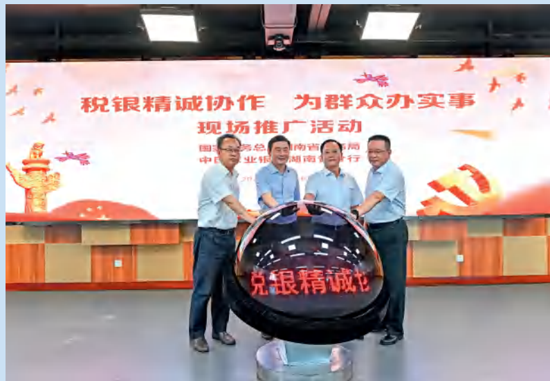
省税务局与省农行联合举办“税银精诚协作 为群众办实事”现场推广活动。

减税降费红利有效释放。 不断夯实税费优惠政策落实工作机制，坚持以最快速度、最大力度、最高效率推动政策红利直达市场主体。一是政策辅导精细精准。编印服务“三高四新”战略定位和使命任务、支持湖南自贸试验区高质量发展等3个政策指引，确保优惠政策“看得懂、算得清”。全面推行网格化服务、精准化宣传、便捷化办理、绩效化考核，2700余名税收志愿者以“线上+线下”的方式开展税费政策宣传，确保优惠政策直达快享。二是政策落实有序有力。抓好今年新出台和延续实施的税费优惠政策落实落地，2021年预计新增减税降费240亿元左右，减轻了企业