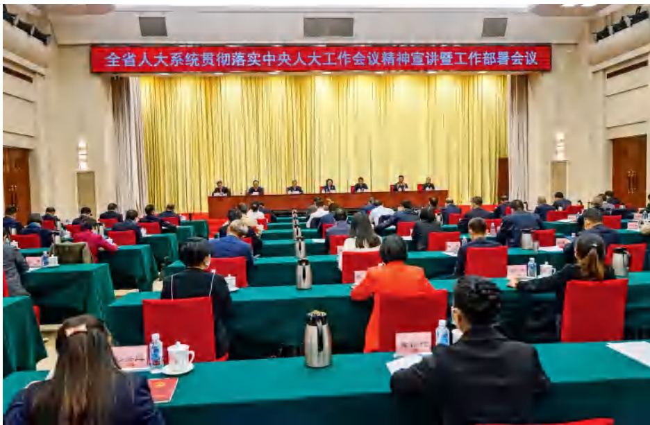
2021年11月5日，省人大常委会召开全省人大系统贯彻落实中央人大工作会议精神宣讲暨工作部署会议。

省人大常委会把学习宣传贯彻会议精神作为重大政治任务，迅速组织传达学习，广泛深入宣传宣讲，多措并举推动中央人大工作会议精神特别是习近平总书记重要讲话精神走深走实，努力把学习成效转化为推动新时代地方人大工作高质量发展的履职实践。