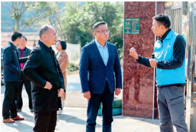
2021年12月17日，省人大常委会信访办调研组在岳阳县调研人大信访工作。

省人大常委会信访办坚持在学深悟透、融会贯通上强化政治自觉、夯实本领功夫，着力推动中央人大工作会议精神在人大信访工作实践中走深走实、见行见效。