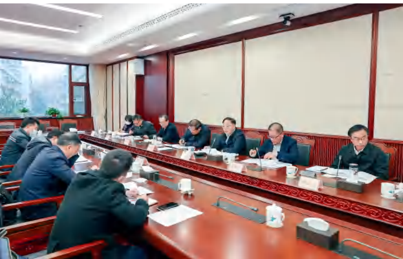
1月5日，省人大财经委召开第46次全体会议审查预算。

习近平总书记明确提出“要用好宪法赋予人大的监督权，实行正确监督、有效监督、依法监督”，为做好新时代人大预算审查监督工作指明了前进方向，是开启新时代人大预算审查监督新局面的“总钥匙”。