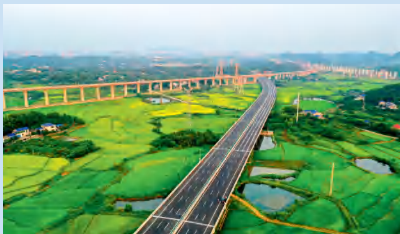
邵阳路桥承建的绿色公路——长益高速公路扩容工程。

邵阳路桥多次获得“詹天佑奖”“全国工人先锋号”“中国公路建设行业百佳企业”“湖南省先进施工企