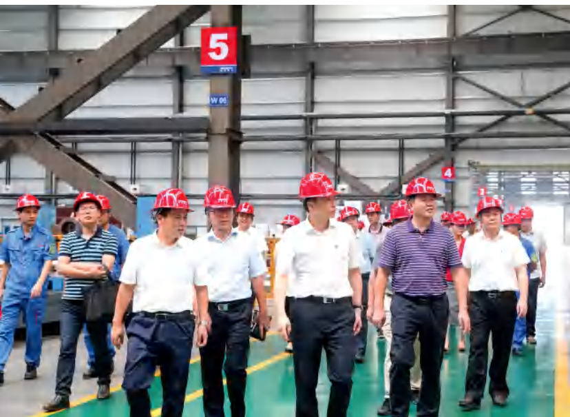
益阳市人大常委会开展中心城区园区产业发展情况专题调研。

益阳市委、市人大常委会及时传达学习贯彻中央和省委人大工作会议精神，对加强和改进全市人大工作作出了部署安排，推动人大工作整体质效提升，以高效能履职助力现代化新益阳建设。