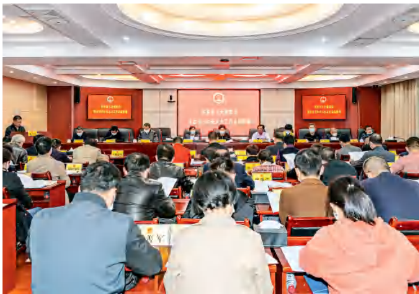
2021年10月19日，东安县人大常委会专题传达学习中央人大工作会议精神。

提出一件议案、建议。市六届人大代表结合实际开展自学活动，并深入基层，走访选民，了解群众所思所想所盼，确保在会议期间提出高质量的议案、建议，确保市六届人大一次会议期间，非职务代表原则上每人至少提出一件高质量的建议，践行发展全过程人民民主，完善常委会组成人员联系人大代表、人大代表联系人民群众的工作机制，发挥代表的桥梁纽带作用，把人民群众的智慧 and 力量汇集到建设新永州的