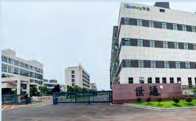
世通纸塑箸业有限公司。

对于如何在后段履职中持续发力，孙泽军表示，将结合“三高四新”战略，在工业互联网建设、高端装备智能制造、知识产权保护和运用等方面开展调查研究，为长沙建设国家重要先进制造业中心、国家科技创新中心、内陆地区改革开放引领城市建言献策，为提高星沙在湖南发展版图中的地位贡献更多力量。