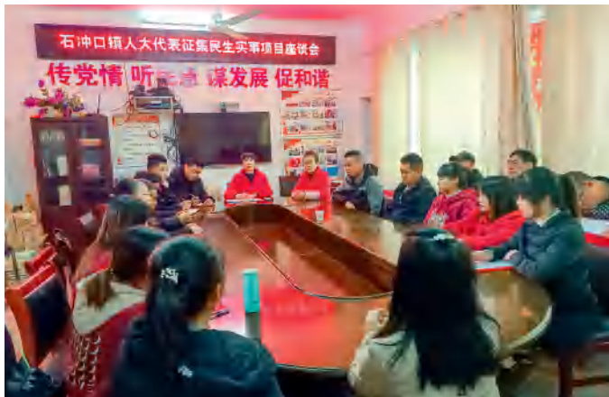
新化县石冲口镇人大代表征集民生实事项目座谈会现场。

2021年10月13日至14日，中央人大工作会议在北京召开，中央人大工作会议的召开，在我国社会主义民主政治建设中具有里程碑意义。作为基层的人大工作者，我们站在新的历史起点上，要用实际行动书写践行全过程人民民主的崭新篇章。