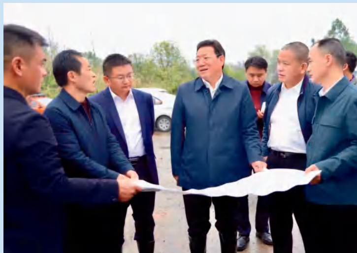
邵阳市委副书记、市长华学健在邵阳经开区调研重点项目建设。

2021年9月28日，中国共产党邵阳市第十二次代表大会胜利召开，会议报告提出，真抓实干勇担当，凝心聚力促发展，为落实“三高四新”战略定位和使命任务建设现代化新邵阳不懈奋斗。