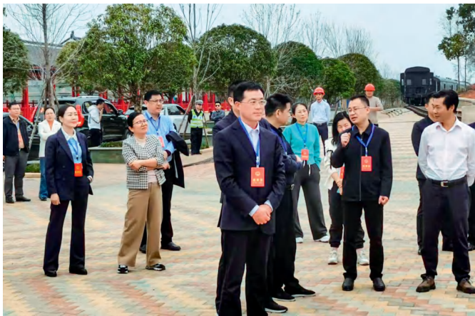
汉寿市人大常委会组成人员集中视察清水湖片区建设工作。

依法监督，是宪法赋予人大的重要职能；助推发展，是时代赋予人大的重要使命。近年来，汉寿县人大常委会聚焦高质量发展的痛点难点，综合运用调研、视察、执法检查、工作评议等方式，依法履行职权，助推县委决策部署落实落地，为推动地方经济社会高质量发展贡献人大力量。