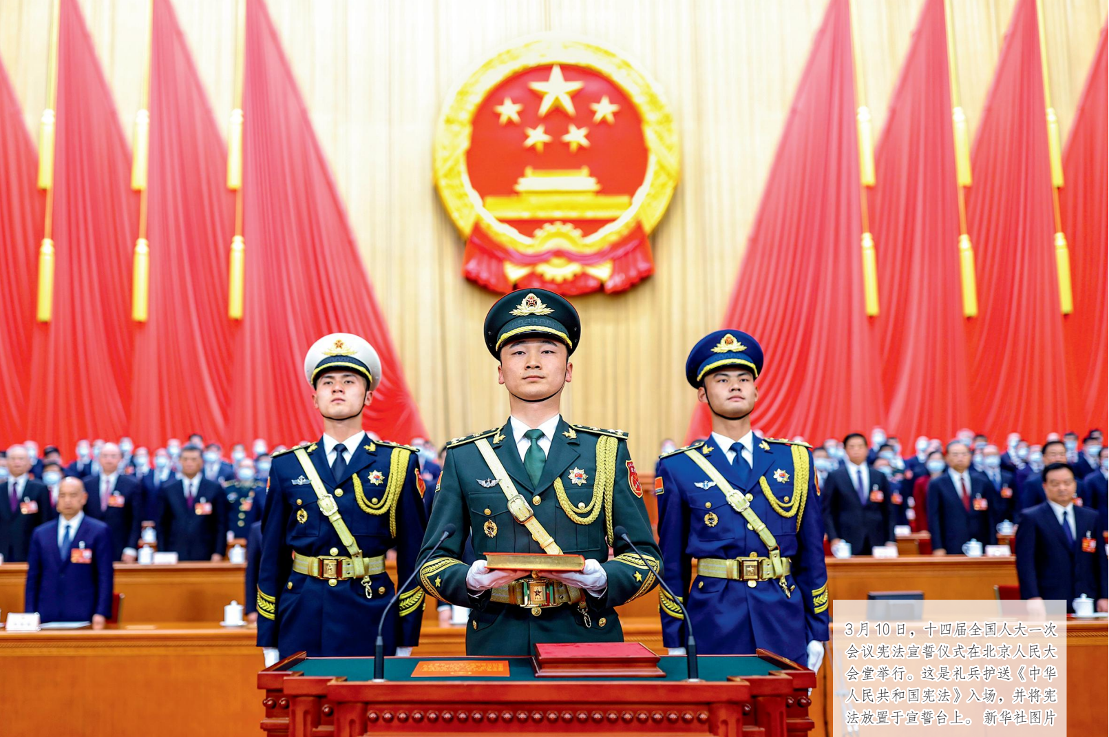
3月10日，十四届全国人大一次会议宪法宣誓仪式在北京人民大会堂举行。这是礼兵护送《中华人民共和国宪法》入场，并将宪法放置于宣誓台上。

来理解，也可以从程序过程的角度来理解。这里，主要从宪法的指导思想、原则、制度等实质内容的维度来认识和把握其关于人民民主的规定（即全过程人民民主最核心的内容）。实际上，我国宪法通过一系列根本法规范重述了适合中国国情的全过程人民民主理念，实现了对这一重大理念的宪法化和最高法治表达。