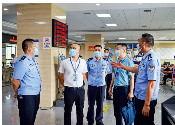
澧县人民法院、澧县人民检察院代表联络站组织代表走进交警队，调研了解执法工作情况。

澧县深入开展“百名代表听庭审、百名代表助执行”行动、“人大代表进执法部门”活动，开展执法司