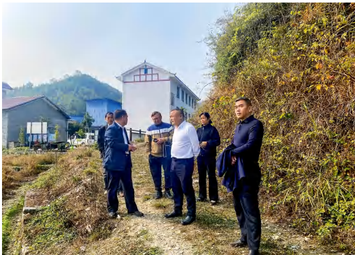
麻阳苗族自治县人大常委会主任阳承凡带队，在江口墟镇公馆村督办人大代表“微建议”。

“祝贺你当选十四届全国人大代表，在履职服务保障方面有什么需求可以向我们提。”日前，麻阳苗族自治县委书记江涛在走访联系十四届全国人大代表龙荣时，征求她的意见、建议。