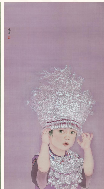
《谁家黛帕乖系列之一》 92cm×50cm