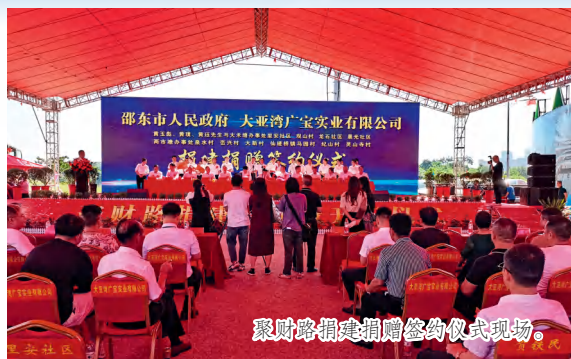
聚财路捐建捐赠签约仪式现场。

社会大局在深化综合治理中和谐稳定。 持续推进自建房安全隐患排查整治、交通问题顽瘴痼疾等一系列专项整治行动，安全生产事故起数和死亡人数“双下降”，获评“全省安全生产和消防工作优秀单位”；全面完成污染防治“夏季攻势”任务，扎实推进“利剑行动”、中央生态环保督察、省环保督察“回头看”反馈问题整