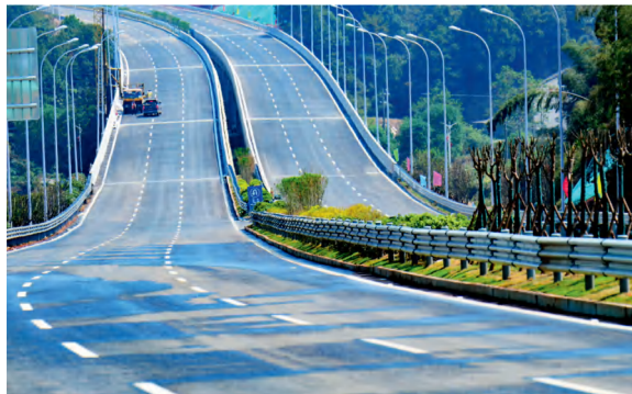
浏阳市金阳大道三期沥青摊铺施工现场。