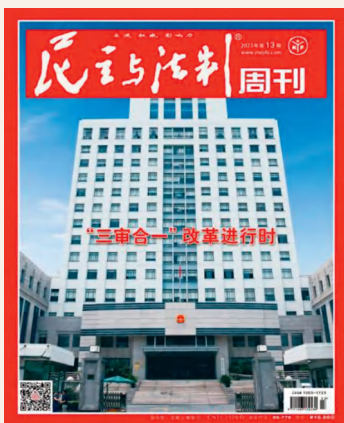
《民主与法制周刊》2023年第13期