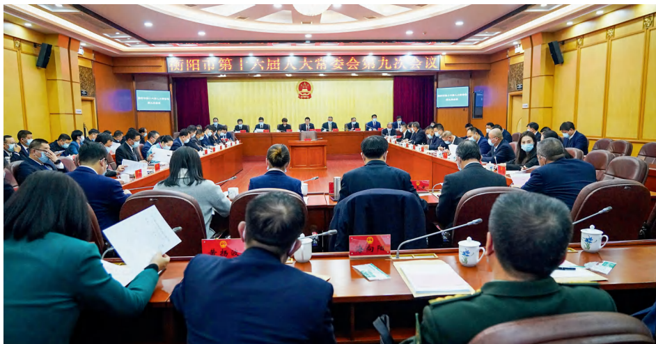
衡阳市十六届人大常委会第九次会议首次对市人大常委会审议意见落实情况开展满意度测评。

为确保审议意见有效落实，切实推进相关工作，衡阳市人大常委会首次对审议意见落实情况进行满意度测评，迈出监督新步伐。