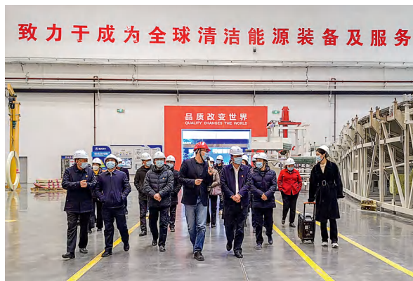
韶山市人大常委会组织部分市人大代表视察“文旅兴城”计划重点项目建设情况。

2022年10月，韶山市人大常委会启动履职评议工作，将韶山市文化旅游广电体育局纳入履职评议范围，成立由市人大科教文卫委牵头的履职评议调查小组，深入开展履职情况调查。市十届人大常委会第八次会议对市文化旅游广电体育局开展工作评议，提出建议，督促履职，以文旅工作水平提高带动文旅产业高质量发展。