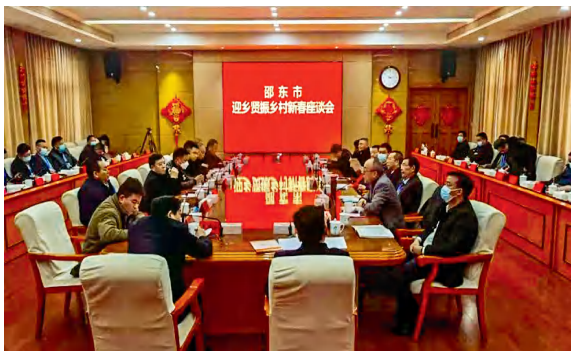
邵东市迎乡贤返乡新春座谈会。

2022年，邵东市坚持以习近平新时代中国特色社会主义思想为指导，以学习宣传贯彻党的二十大精神为主线，团结奋斗、拼搏进取，交出了殊为不易的发展答卷。全年实现地区生产总值721.5亿元，增长5.1%；城乡居民人均可支配收入分别增长6.2%、7.3%。成功创建省级文明城市，“五好”园区创建、推动高质量发展等6项工作获省人民政府真抓实干表扬激励。