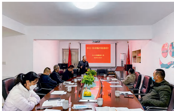
天心区大托铺街道人大工委组织人大代表进行集中学习，为代表履职赋能。

源优势，通过代表牵线，先后引进0123露营基地、闻雨小院、瞰见文化传媒等新消费业态，推动乡村经济发展。