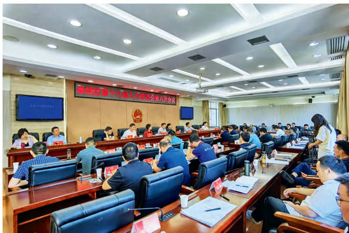
2022年6月14日，常德市鼎城区十八届人大常委会第八次会议审议通过关于建立代表建议与公益诉讼检察建议衔接转化工作机制的决议。

调研组在充分调研的基础上，同时借鉴益阳市人大常委会及衡南县人大常委会的成功经验，起草了关于建立代表建议与公益诉讼检察建议衔接转化工作机制的决议草案。衔接转化机制贯彻“小、快、灵”的思路，突出解决生态环境和资源保护、食品药品安全、国有财产保护、国有土地使用权出让和安全生产、英烈权益保