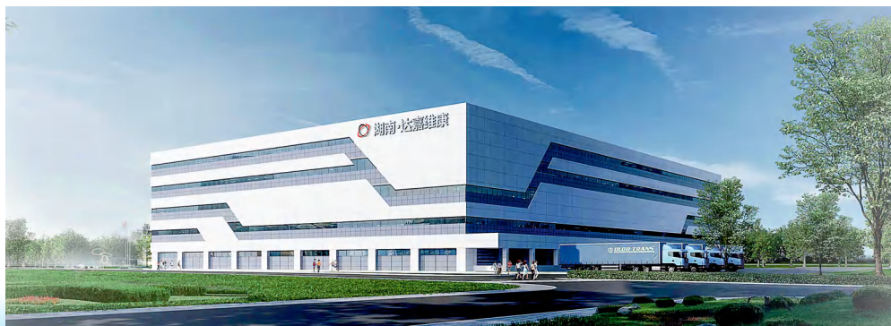
达嘉维康智能物流中心正在建设中。

公司积极履行社会责任，为各类公益事业捐资达 3000 多万元。公司先后获得湖南省“最具社会责任医药企业”、“湖南省疫情防控突出贡献企业”、湖南省“万企帮万村”精准扶贫行动先进民营企业等多项荣誉称号。