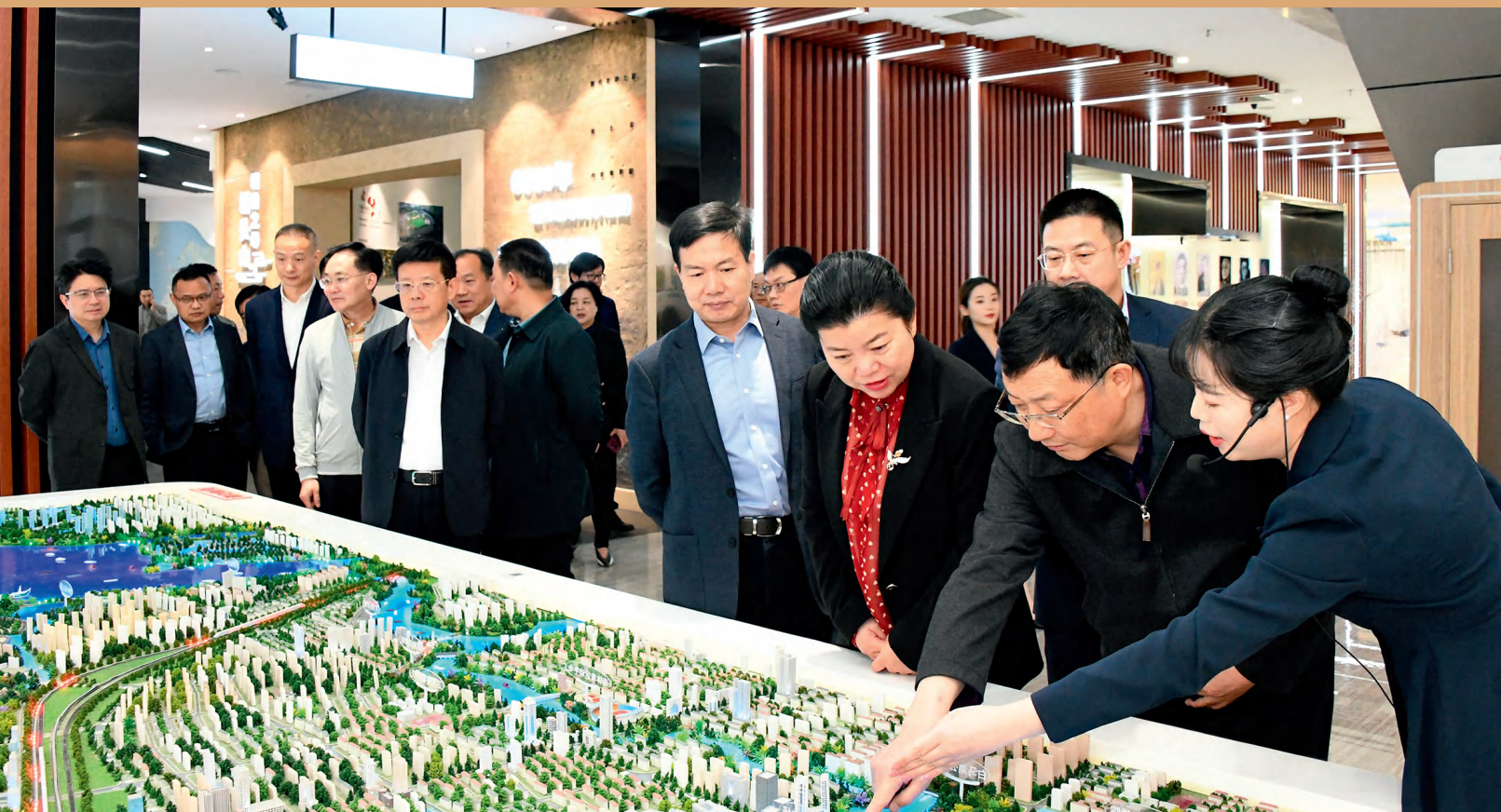
3月14日，常德市人大常委会调研组对国土空间总体规划编制工作开展调研。