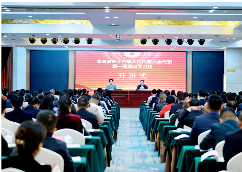
4月23日至25日，首期省十四届人大代表履职学习班在长沙举行。

乌兰指出，人民代表大会制度的优势功效，是通过一个一个代表的履职尽责彰显出来的。她勉励代表们加强政治学习，坚定正确政治方向，站稳政治立场，进一步提升政治把握的能力；把握好整体与局部、当前与长远、尽力而为与量力而行、“质”与“量”的关系，进一步提升建言献策的能力；聚焦“问题”这一靶向，突出“研究”这一重点，抓住“转化”这一关键，进一步提升调查研究的能力；在履职实践中努力当好传达上情的宣传员，反映下情的信息员，矛盾化解的协调员，改善民生的服务员，进一步提升联系群众的