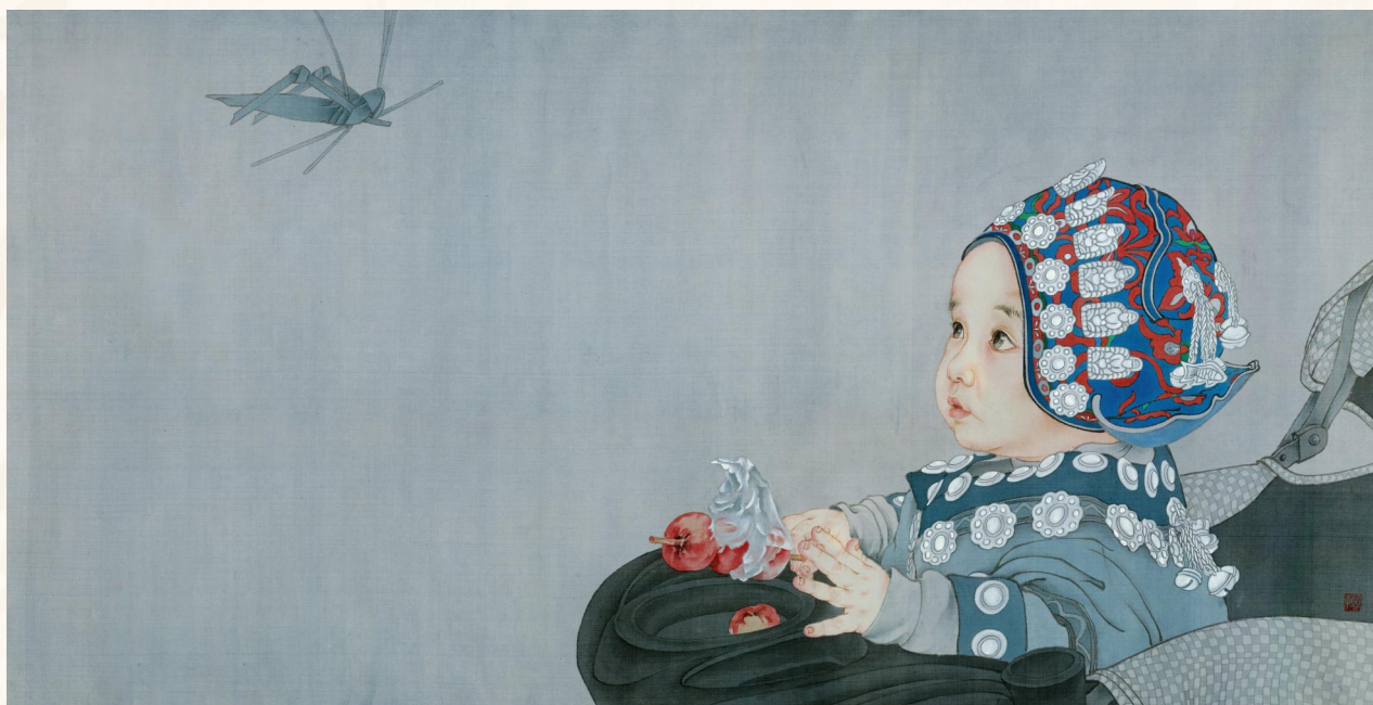
《摇啊摇，摇到嘎婆桥》 50cm×92cm