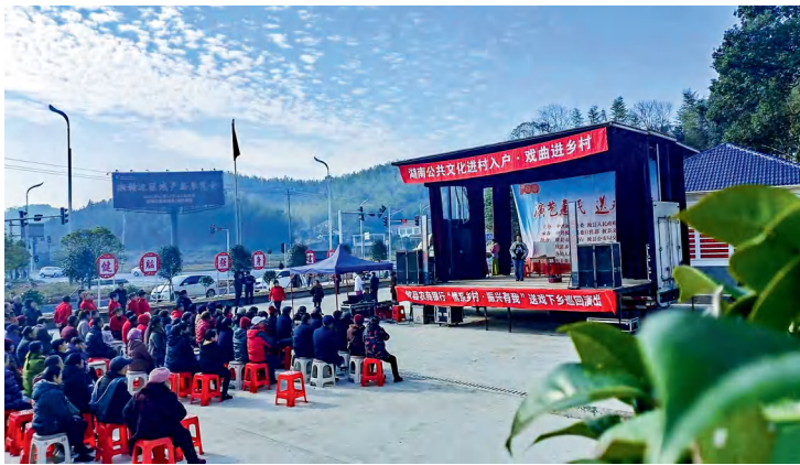
攸县酒埠江镇柘桑村万利组利用门前小广场开展“戏曲进乡村”活动。

县人大常委会坚持“从群众中来，到群众中去，一切为了群众”的实践理念，通过“门前三小”平台开展内容丰富、形式多样的活动，在为基层人民提供优质文化服务的同时，收集群众困难诉求，让社情民意既“通天线”，又“接地气”。