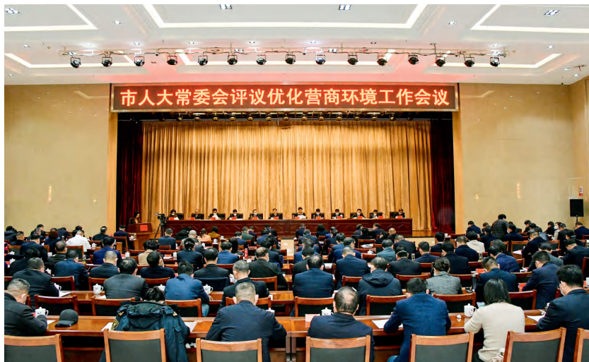
常德市人大常委会评议优化营商环境工作会议现场。

2022年1月2日，市八届人大常委会第一次会议召开，旗帜鲜明地将“与时俱进、守正创新、主动作为、干在实处、走在前列”作为新一届人大工作的总体要求，全力建设“四个机关”。1月21日，市人大常委会党组制定出台《关于加强新一届常委会党组领导班子建设的意见》，从全面加强政治建设、切实提高履职能力、密切联系服务群众、营造干事创业氛围、维护自身良好形象5个方面，共提出19条具体实施举措，为加强常