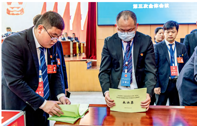
东安县十八届人大三次会议通过代表票决确定县人民政府2023年度民生实事项目。

“东安县十八届人大三次会议听取和审议了《东安县人民政府关于2023年度民生实事候选项目形成过程及基本情况的报告》。会议对候选项目进行无记名投票表决，确定大盛镇至花桥岔路口公路提质改造工程和农村人居环境整治提升行动2个项目为东安县人民政府2023年度民生实事项目。”3月23日，在东安县十八届人大三次会议上，当主持人宣布县人民政府2023年度民生实事项目投票表决结果时，会场响起了热烈的掌声。自此，东安县乡两级人民政府年度民生实事项目全部实现人大代表票决。