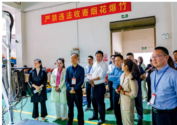
石门县人大常委会组织人大代表就信访室收集的民营企业发展相关问题，开展现场调研。

代表轮流值班接待选民，集中收集意见建议，定期向人大常委会反映，建立了人大代表参与信访工作的机制。