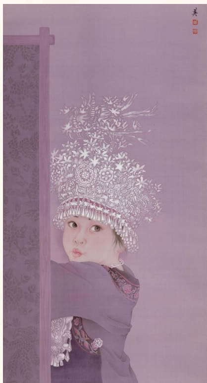
《谁家黛帕乖系列之二》 92cm×50cm