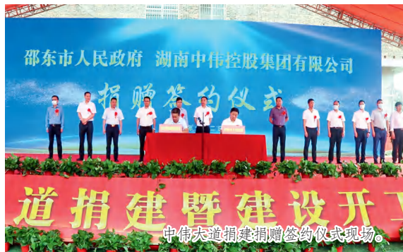
中伟大道捐建捐赠签约仪式现场。