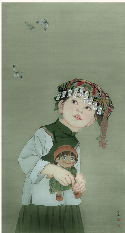
《蝶儿飞飞系列之一》 100cm×60cm