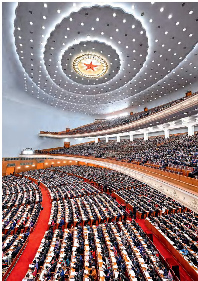
十四届全国人大一次会议表决通过了关于修改立法法的决定。

改革开放以来，随着经济社会快速发展，我国立法体制不断发展完善。1979年地方组织法赋予省、自治区、直辖市人大及其常委会制定地方性