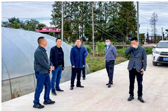
安乡县人大常委会重点处理建议办理督办工作组在安障乡王家湾村产业路调研。

县人大常委会根据重点处理建议评议工作暂行办法，围绕重点处理建议的督办办法，创新督办方式，坚持全过程跟踪督办，聚焦办前、办中、办后三个关键环节，采取“走出去”和“请进来”相结合，推进县人大常委会联工委“全面督”，县人大专委会、常委会工作机构“对口督”；开展评议前，牵头督办重点处理建议的相关委室“现场督”；重点建议测评时，邀请建议领衔代表和乡镇人大主席参与“扩面督”，充分发挥重点处理建议办理的示范引领作用，以办理工作的实际成效回应群众和代表的关切。针对安障乡王家湾村大棚蔬菜种植农户多次反映的村里交通不便、农产品运输难问题，县人大代表提出关于推进产业路建设、解决群众难题的建议，承办单位县交通局通过向上争资争项、引进项目建设、强化基建赋能等举措，为该村修了一条产业路，大大方便了群众。在县人大常委会的督办下，经承办单位的不懈努力，全县投资金额6000多万元，建设