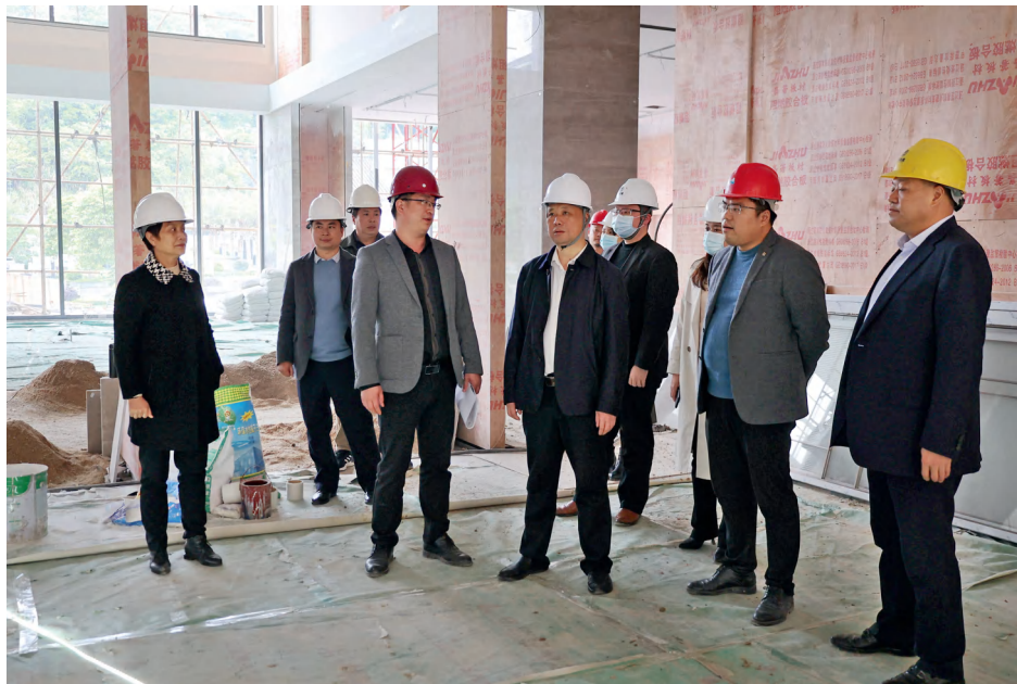
汝城县人大常委会调研组到暖水温泉项目现场开展稳岗就业工作调研。