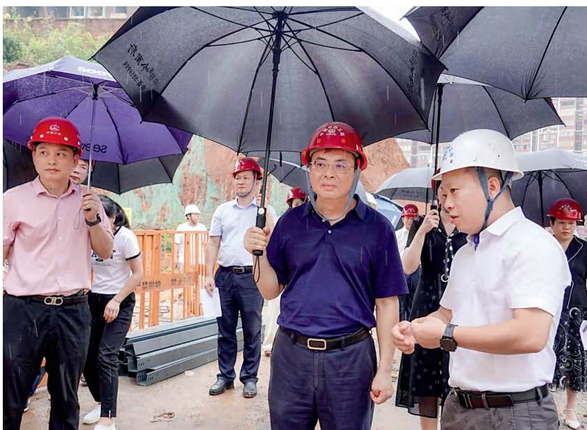
2023年7月，郴州市人大常委会组织人大代表对关于保障教育资源投入促进教育高质量发展的建议开展跟踪督办。

监督合力。建立政府债务审查监督“三专”机制，推动党中央关于地方人大加强对政府债务审查监督的决策部署落实落地。完成城建环资领域联网监督系统三期建设。这些工作均走在全省前列。在全省率先出台“两官”履职报告工作暂行办法，率先实现市县两级评议全面铺开，取得了用评议“出汗”促工作“出彩”的良好成效，2022年全省“两官”履职评议工作推进会在郴州召开。2023年初，确定市发改委主任等8名同志为2023年市人大常委会听取和审议市政府工作部门行政正职履职情况报告对象，成立8个调查组分赴相关部门对履职报告对象全面“体检”和“透视”，督促其依法履职尽责、提升工作效能。