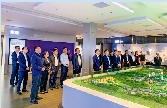
郴州市委主要领导在郴州陆港中心调研。

郴州陆港规划总用地面积 26.38 平方公里，包括核心区（湘南国际物流园区和苏仙区坳上片区）17.89 平方公里、拓展区（苏仙区五里牌片区）5.77 平方公里、