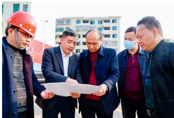
资兴市人大常委会主任会议成员集中视察，为开展人大工作考核作准备。

大工作有关情况进行收集整理，起草形成关于市管领导班子和领导干部年度考核2022年度人大工作综合情况汇报，做好综合评价的前期准备工作。