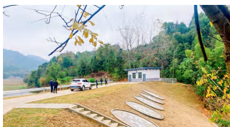
赫山区龙光桥街道铜钱湾水库。

为解决水库管理方面的难点、痛点问题，2021 年赫山区开始小型水库管理体制改革，紧紧围绕夯实水库安全基础、充分发挥水库效益、打造优美水库环境的目标，坚持管理手段、管护模式、考核机制创新，建立健全各项规章制度、完善管理设施，落实“管护责任、经费渠道、专业管护人员、管理和保护范围”四项措施，推进水库管理标准化建设，成为湖南省第一批深化小型水库管理体制改革样板县，正在全力推进创建水利部小型水库标准化管理达标工作。