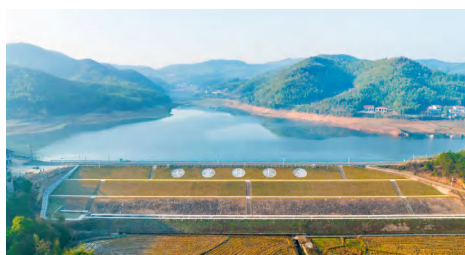
泥江口镇七里冲水库。