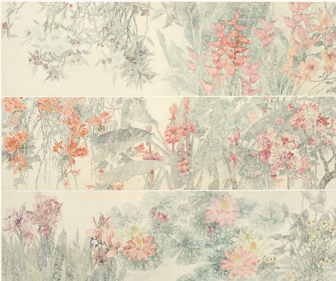
《群芳图》153cm x 180cm