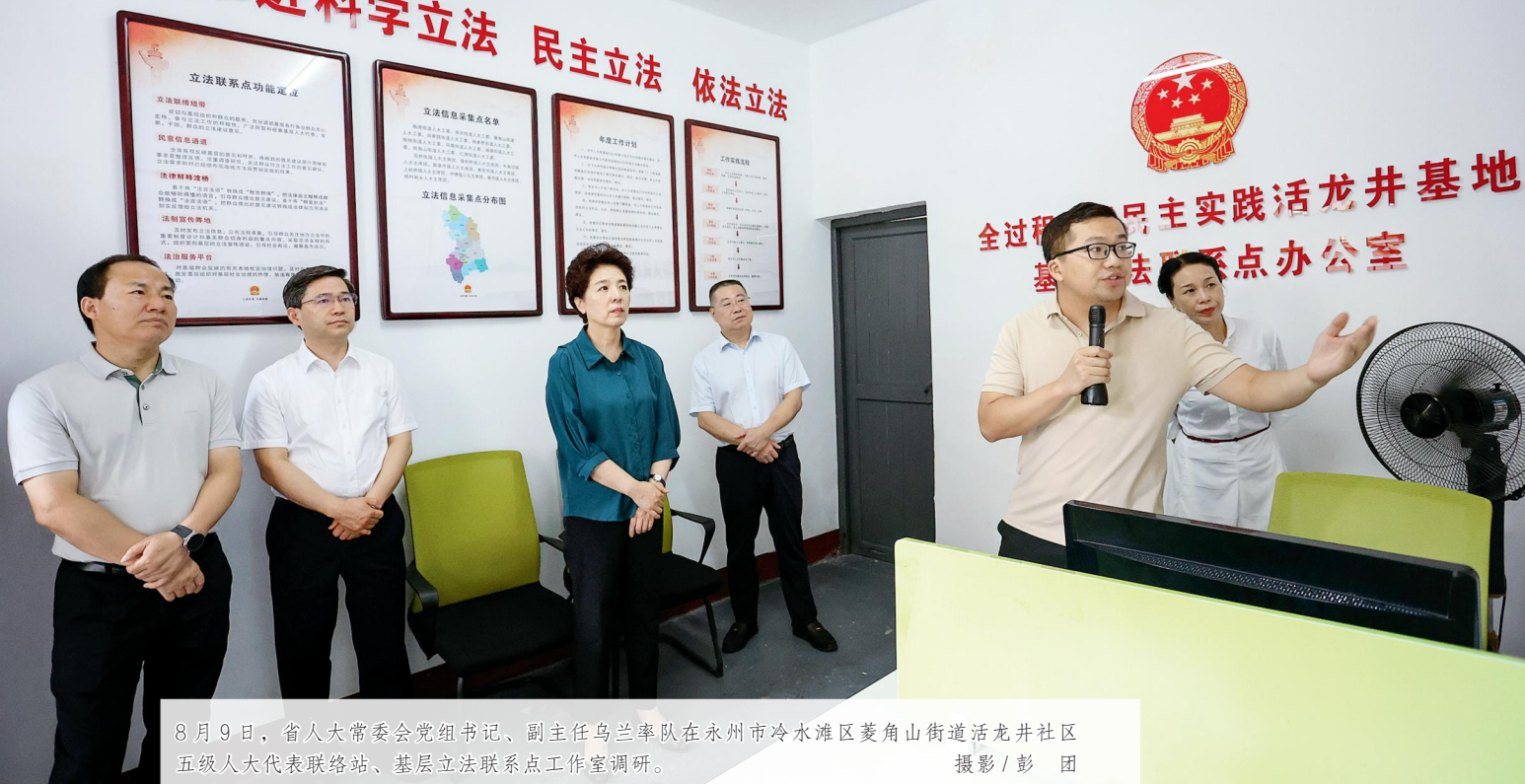
8月9日，省人大常委会党组书记、副主任乌兰率队在永州市冷水滩区菱角山街道活龙井社区五级人大代表联络站、基层立法联系点工作室调研。