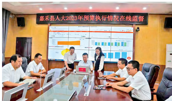
嘉禾县人大常委会运用预算联网监督系统开展在线监督。

监督的内容和方式，实现预算监督由静态时点向动态实时、传统“线下”报表向“线上线下”结合、单一预算向财经综合转变，让预算监督看得更准、观得更广、盯得更严，有效推动预算审查监督全过程、全覆盖、全方位。为规范平台的运行和使用，县人大常委会先后制定预算联网监督系统管理办法、问题反馈处理制度等11项制度，形成“旬观察、月分析、季报告”“发现问题—移交问题—问题整改—结果反馈—改进措施”的常态监督机制和闭环运行模式。2022年9月，通过平台察看和分析，发现债券资金使用进度慢，县人大财经委及时下达预警提示函，督促县政府加大对涉债资金项目统筹调度，有力推进晋屏大道路网改造、县人民医院分院等重点项目建设。