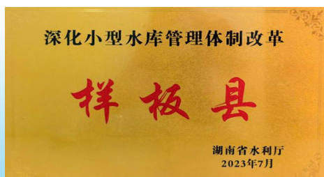
赫山区被省水利厅评为“深化小型水库管理体制改革样板县”。