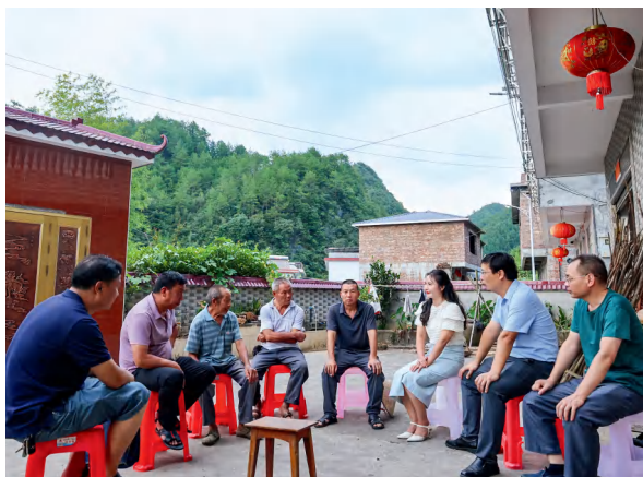
汝城县人大常委会立法信息采集员深入延寿瑶族乡基层立法联系点收集立法意见。

最真实的意见、建议。延寿瑶族乡官亨村村民提出“野外用火要疏堵结合，实行提前报备，专人察看、集中用火”的建议，被郴州市人大法制委采纳，写入了草案。