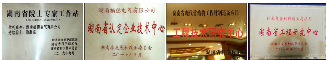
园区内企业获得的部分授牌。

实施创新驱动战略。园内企业拥有发明专利超400件，拥有专精特新“小巨人”企业15家。重点支持装备制造、竹资源精深加工、电子信息三大主导产业和龙头企业与高校院所建立产、学、研孵化基地，共建公共服务平台15家，生产性服务机构11家，产、学、研合作基地6处。