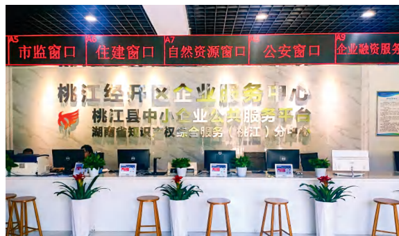
园区企业服务中心。

立足115万亩竹林优势，园区着力打造特色鲜明的生态竹木制造产业集群，集聚桃花江竹材科技、麓上住工、万维竹业等竹深加工龙头企业近15家，其中