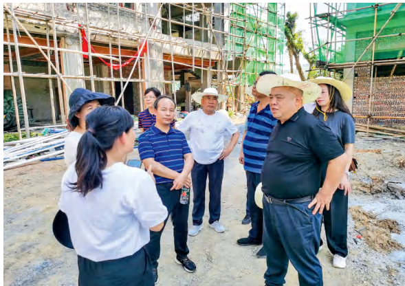
宜章县人大常委会专题视察组在一六镇视察旅发大会项目建设情况。

小小督办卡，督出大作用。县人民政府和各乡镇、项目业主对照问题清单，及时召开会议进行研究，制定切实可行的整改措施，定人定责定时限。各乡镇、各项目业主聚焦问题，疏堵点、攻难点，争时间、抢进度，吹响了“决战一百天，办好旅发会”的冲刺攻坚号角。施工人员战高温、斗酷暑，全力以赴抢工期、拼进度，热气腾腾的施工场景在全县各项目现场随处可见。目前，中央红军长征突破第三道封锁线指挥部旧址、燕子岩景区三期等已建成并开始试运营。