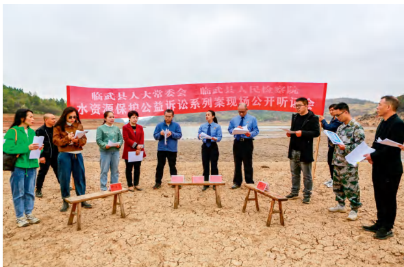
2022年10月28日，临武县人大常委会、县人民检察院就转化后的水资源保护建议召开公益诉讼系列案公开听证会。

“县人民政府要根据代表建议和检察建议建立全县二次供水管理机制，推动二次供水领域系统治理。”日前，在临武县二次供水领域公益诉讼专项监督活动现场，人大代表直言不讳提出建议。