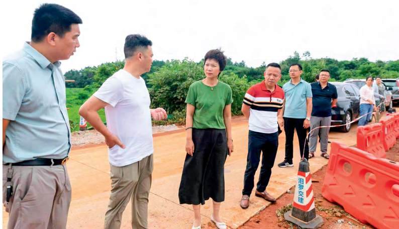
汨罗市人大常委会督导组在民生实事项目建设现场调研。

目。11月21日至23日，市人民政府领导班子成员集中走访人大代表，经征询代表意见，剔除1个项目，增加1个项目，形成7个候选项目，经提请市人大常委会会议、市委常委会会议审定，最终确定了7个候选项目提交汨罗市人民代表大会票决。