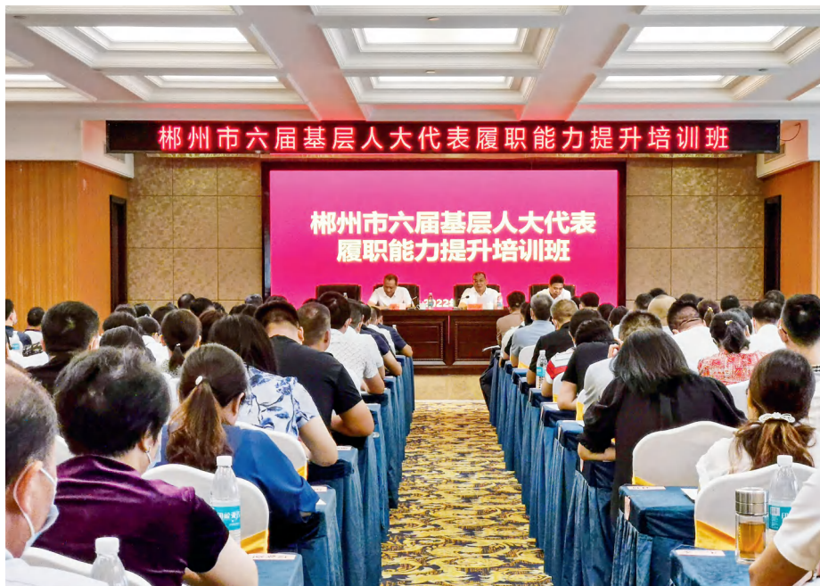
2022年9月，郴州市人大常委会举办市六届基层人大代表履职能力提升培训班。

作的首要政治原则，牢牢把握人大制度、人大工作在坚持“三者有机统一”中的职责定位，自觉把人大工作放在全市工作大局中来谋划、来推进，确保郴州人大各项事业发展始终围绕党中央大政方针和省委决策部署、市委工作要求展开。