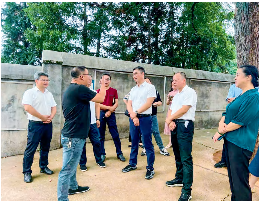
雨湖区人大常委会调研组在姜畲镇塔岭学校开展调研。

湘潭市雨湖区人大常委会紧扣扁平化治理改革任务，以“五个一”为抓手，积极履行法定职责，努力打造雨湖人大工作品牌。