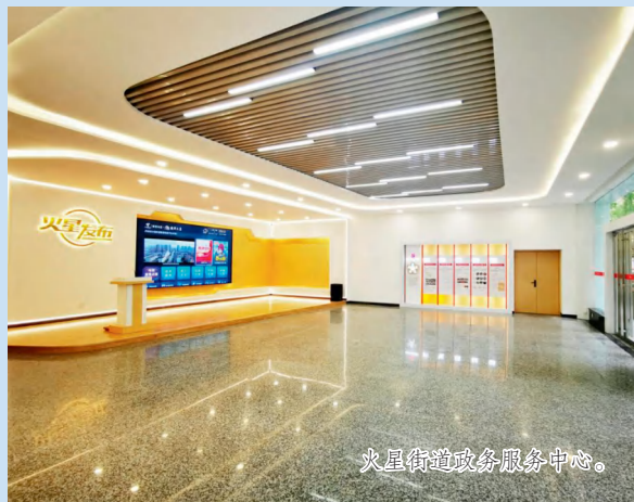
火星街道政务服务中心。

人居环境全面改善。 近年来，火星街道联合公安、执法等部门对马王堆海鲜市场及周边开展综合整治行动，重点整治违建房屋、私挖水池、私搭阁楼、“多合一”场所等，截至目前，拆除违章扩建面积 23110 平方