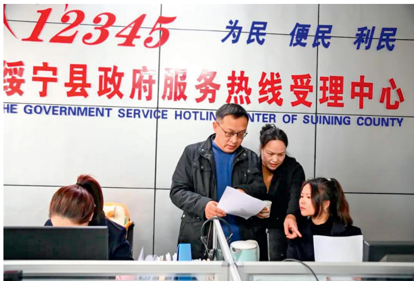
绥宁市人大常委会领导带队调研人大代表向12345热线反映社情民意工作。

近年来，绥宁市人大常委会深入学习贯彻中央人大工作会议精神，对标新时代人大工作新任务新要求，聚焦“加强和改进”，积极探索做好新时代人大工作的新方式、新方法。