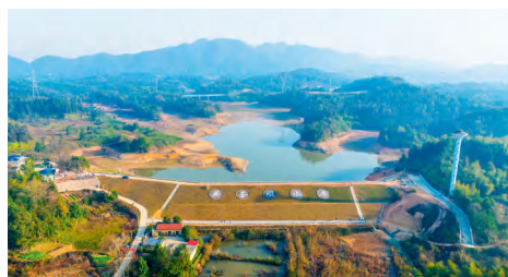
龙光桥街道关圣坝水库。