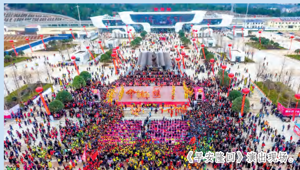
《早安隆回》演出现场。