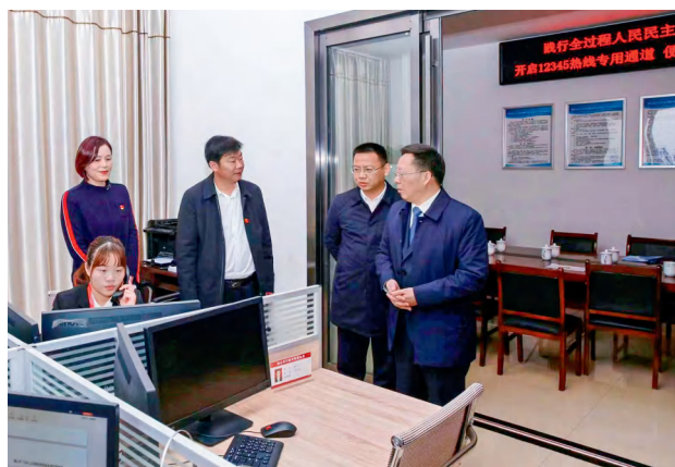
湘潭市、韶山市人大常委会领导检查12345热线运行工作。

论是进站集中接待群众，还是参加走访、调研、视察等代表活动，人大代表可以随时随地拨打热线反映问题、提出建议。热线平台第一时间接收并依程序交办，具体责任单位第一时间进行处理，从而真正让代表反映群众呼声走上“快车道”。韶山市人大常委会联工委相关负责人介绍。