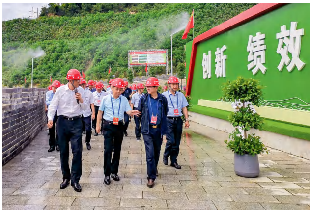
临澧县人大常委会组织五级人大代表在新安镇视察南方新材料矿山生态修复项目建设情况。

县人大常委会组成5个评议调查组，历时2个月，深入基层、企业，召开各类座谈会52场次，走访服务对象600多人次，发放调查问卷1000余份，收集归纳问题104个，并通过领导带队上门交办、小组会议集中交办等形式，将评议问题面对面反馈给各个单位。县人大常委会紧盯不放，通过单位月报告、开展视察、走访座谈等多种途径，督促各单位狠抓问题整改。评议会上，常委会组成人员、人大代表结合日常工作、“十佳十差股室评比”情况，采取无记名投票方式现场测评，确保评议客观公正。会后，县人大常委会将评议测评结果报告县委，通报县政府、县纪委监委以及组织部门，作为单位绩效考核、评先评优的参考，对于上级驻临单