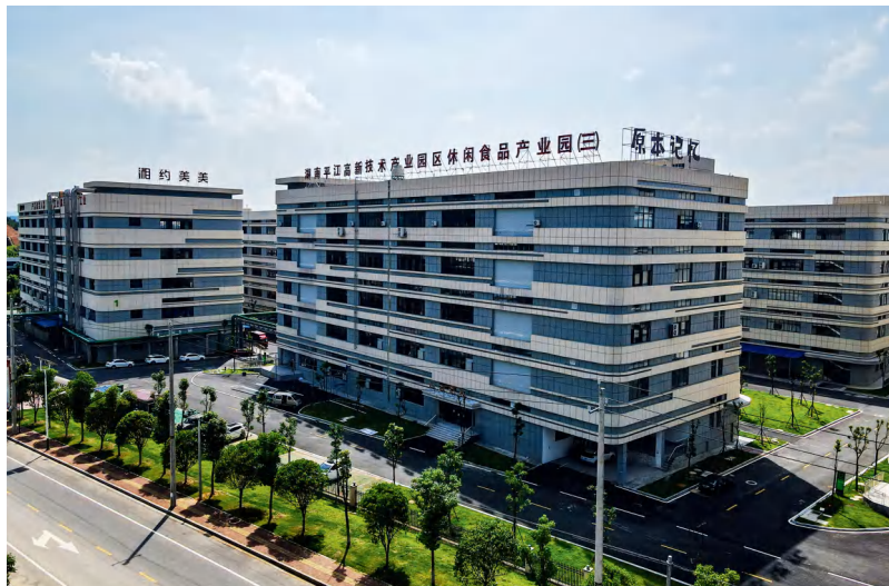
平江高新技术产业开发区休闲食品产业园三期。

平江高新技术产业开发区以“五好”园区创建为抓手，以实现高质量发展为目标，着力强化顶层设计，抓实产业项目，推动改革创新，促进效益提升，2022年主要经济指标增长30%以上，实现税收5.64亿元，同比增长31.78%，在全省“五好”园区创建综合评价中排名第三，省级园区中排名第二，连续两年获评全省“五好”园区创建工作先进园区。