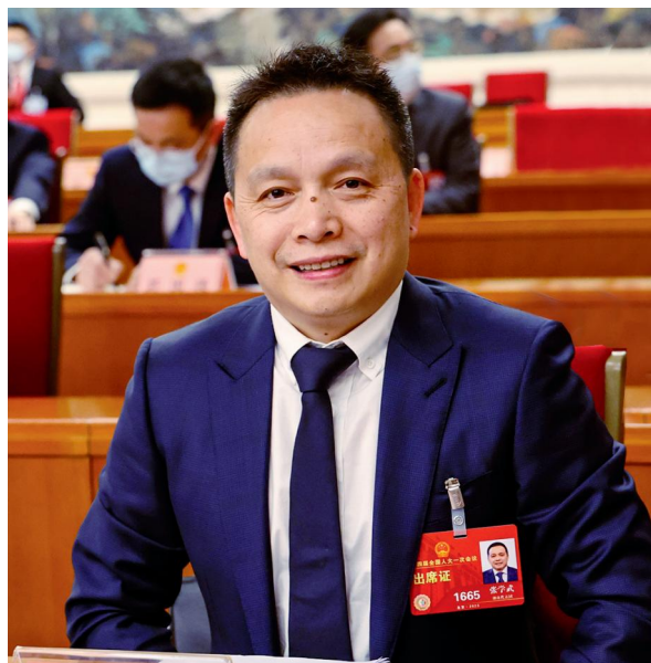
全国人大代表张学武。

发展农产品加工业集群，推动农业产业化与现代化发展。建议政府加强对农产品加工业产业集群的扶持，在融资、财政、税收、用地、用电、环保等方面提供全方位支持，落实生产、税收、市场等相关政策，并加大