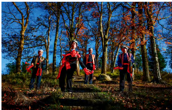
国家非物质文化遗产——“呜哇山歌”。

近年来，隆回县聚焦“三宜三融三区”奋斗目标，真抓实干、攻坚克难，全县实体经济蓬勃发展，社会民生协同推进，城乡面貌焕然一新。奋进新征程，隆回县深入贯彻落实党的二十大精神，全力打好“发展六仗”，奋力谱写中国式现代化的隆回篇章。