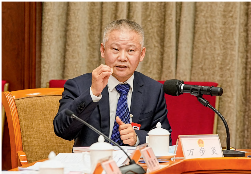
万步炎在十四届全国人大一次会议湖南代表团分组审议时发言。

神秘深海有着丰富的宝藏。按照联合国海洋公约规定，公海矿产资源谁有能力先勘探，谁就拥有优先开发权。彼时，我国受限于海洋技术落后，只能望洋兴叹。“国家的需要就是我的研究方向。”万步炎牢记共产党人的初心使命，把祖国的需要作为自己的奋斗目标。