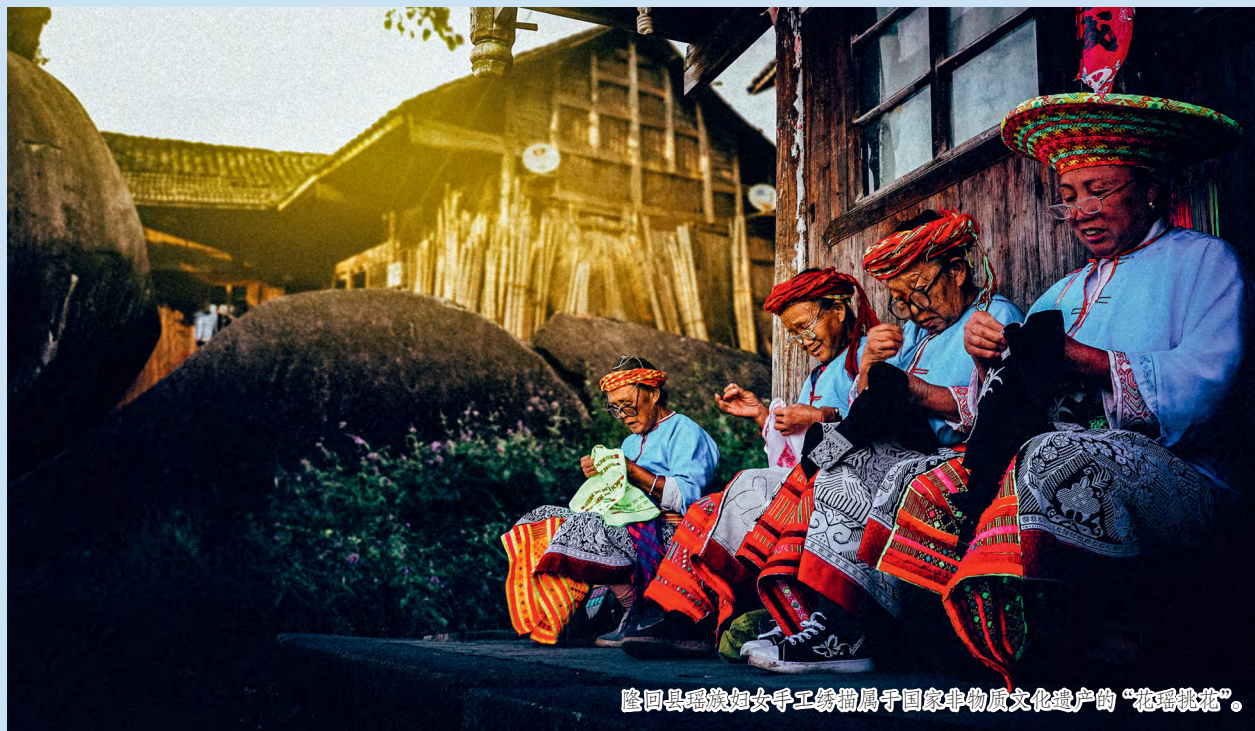
隆回县瑶族妇女手工绣制属于国家非物质文化遗产的“花瑶挑花”。