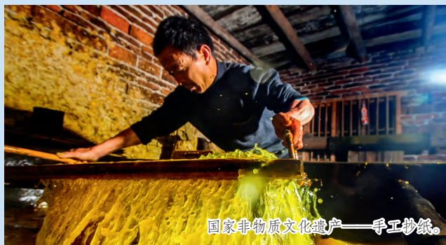
国家非物质文化遗产——手工抄纸。