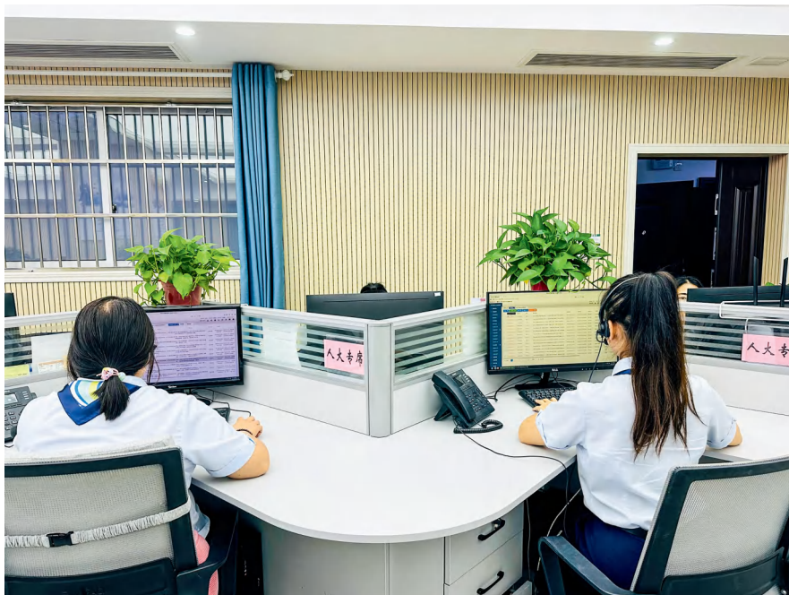
怀化市 12345 政务服务便民热线接听中心设置了人大代表热线接听专席。

运行机制的建立和完善是确保高效率运行的前提。为此，市人大常委会联工委和市政府热线办联合组建工作专班、建立工作机制，形成了“一套人马、两线并行，多方参与、互联互通”的工作格局。同时根据各自职能，在不增加成本和人力的基础上，分工协作，实现了资源共享、合作共赢的目标。