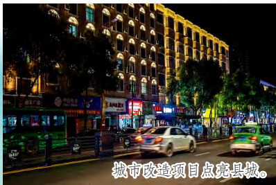
城市改造项目点亮县城。