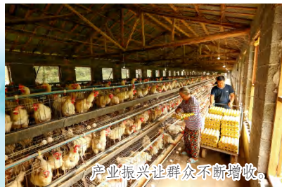
产业振兴让群众不断增收。