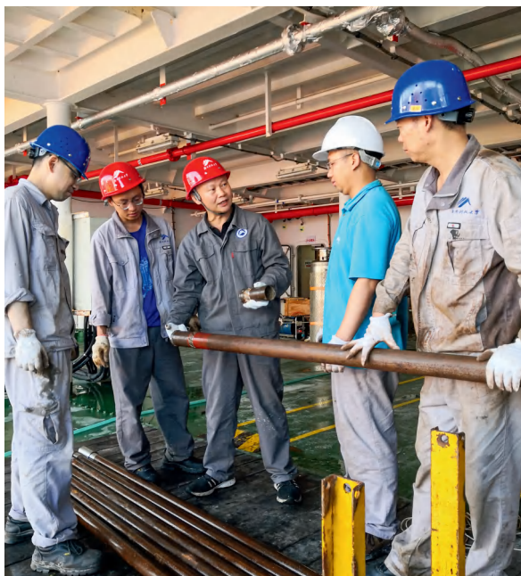
万步炎（中）在海上给团队成员讲课。

这是万步炎第一次以全国人大代表的身份赴京参会。他在大会期间提交的建议，紧扣“科技”这一关键词。他在关于支持湖南加快打造具有核心竞争力的科技创新高地的建议中写道，近两年，湖南区域创新能力连续进位至全国第11位，可以说，湖南正在成为引人瞩目的科技创新热土。他希望国家支持湖南加快打造具有核心竞争力的科技创新高地，通过切实加大科研投入，着力强化人才和教育支撑，合理布局科研平台，探索新型创新模式，加快科技成果产业化，让湖南成为更加引人瞩目的科技创新热土。科技部在答复时表示，将支持湖南加快实施创新驱动发展战略，进一步提升区域创新能级，积极抢占产业、技术、人才、平台“四个制高点”，加快推进“4+4科创工程”，统筹各方面资金和资源投入，积极支持湖南创新发展。