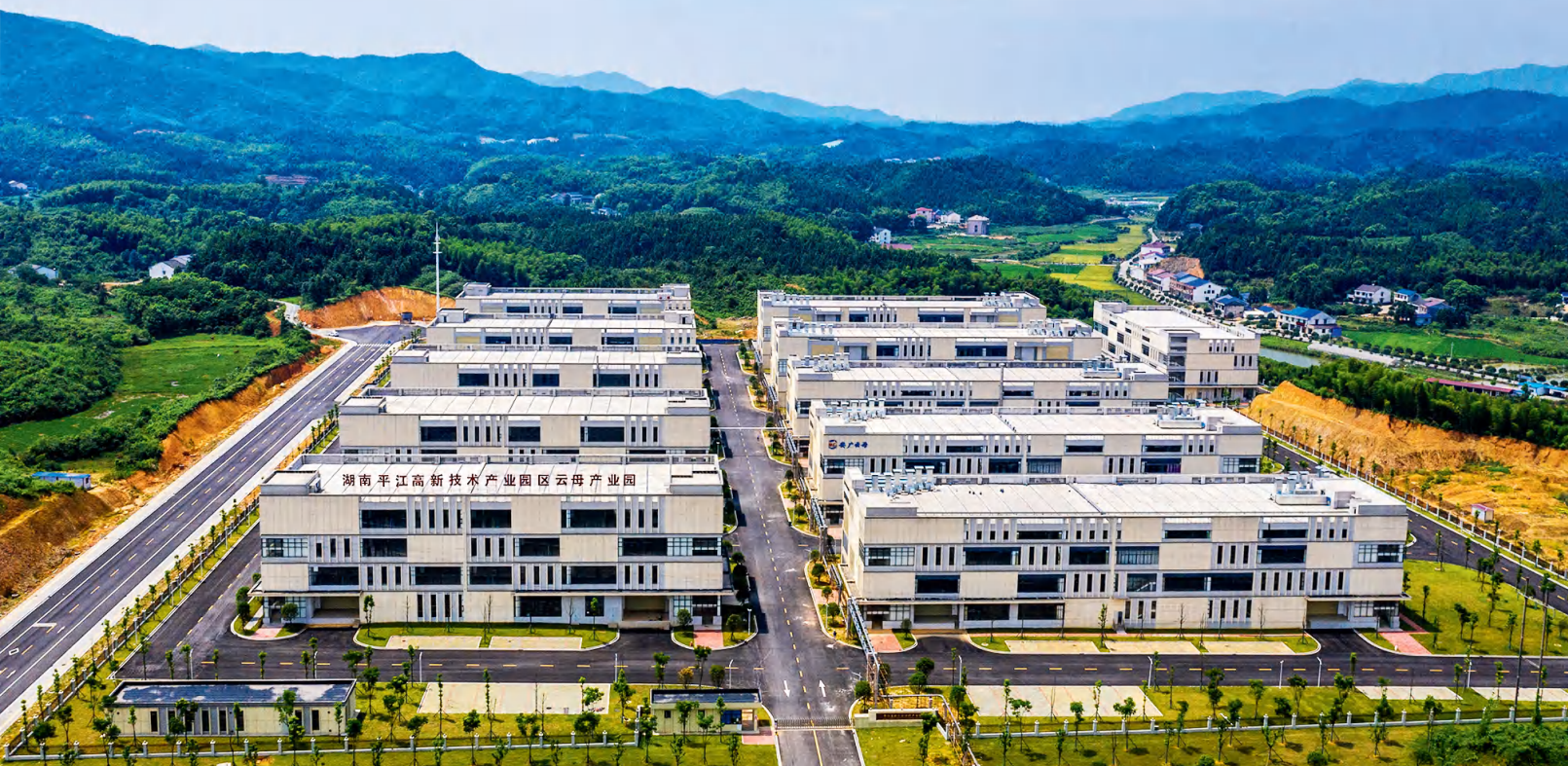
云母产业园区全貌。

抓产业，强基础。大力开展“迎老乡、回故乡、建家乡”主题招商活动，实施“平商回归”工程，通过深入走访、举办节会、领导推介等方式，吸引“鸿雁归巢”。2022年，引进产业项目46个，乡友项目占比达50.3%。