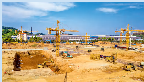
休闲食品产业园开工现场。