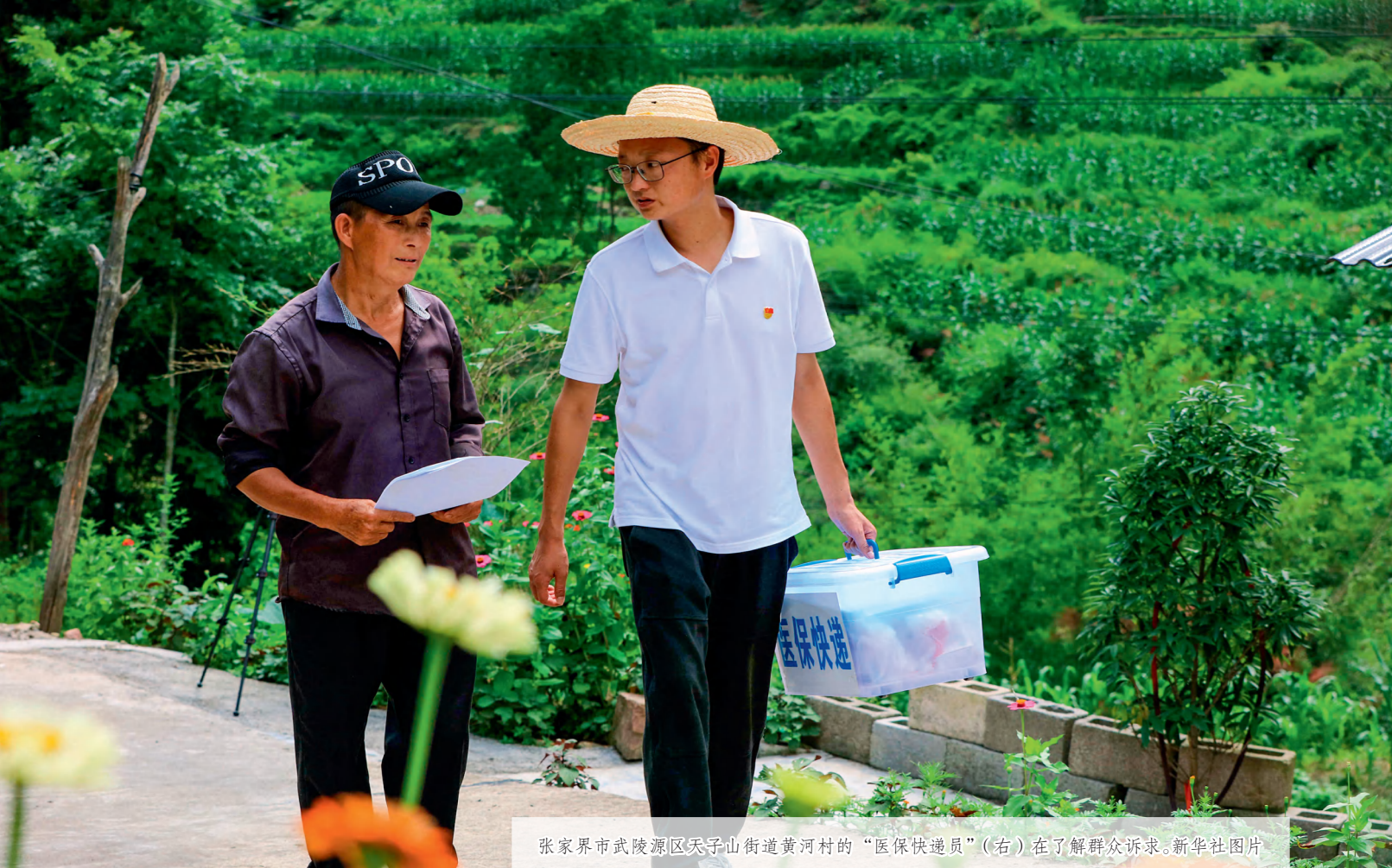
张家界市武陵源区天子山街道黄河村的“医保快递员”（右）在了解群众诉求。

在十四届全国人大一次会议上的讲话中指出，要把人民代表大会制度坚持好、完善好、运行好。这有利于实现和发展全过程人民民主，有效保障和实现人民当家作主。