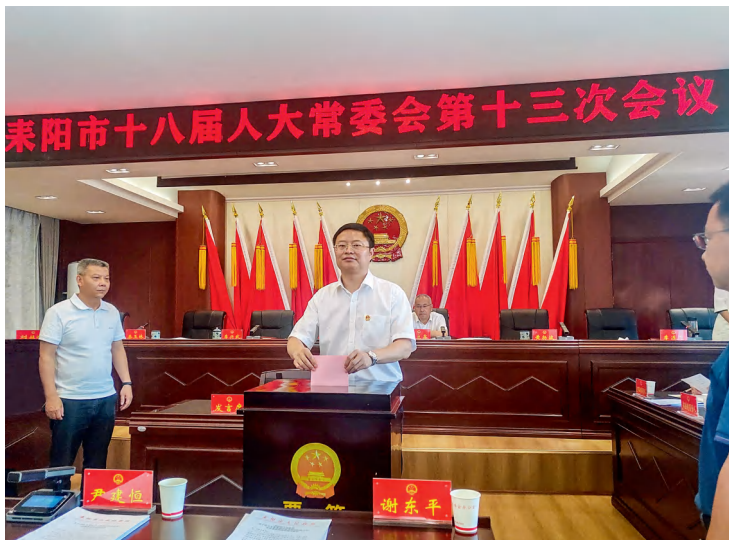
在耒阳市十八届人大常委会第十三次会议上，市人大常委会组成人员对“一府一委两院”审议意见办理落实情况进行满意度测评。

耒阳市人大常委会首次对“一府一委两院”审议意见落实情况开展满意度测评，坚持“问题解决不到位不放手，审议意见不落实不罢手”。