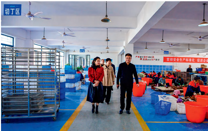
3月15日，靖州苗族侗族自治县人大常委会调研组就茯苓产业高质量发展开展调研。

合运用听取汇报、委托自查、现场考察、走访群众、问卷调查、召开座谈会等方法，并吸纳熟悉相关工作的人大代表和专业人士参加，掌握第一手资料，提高调研的真实性、全面性和代表性；调研后，对调研报告经反复研究、修改后，提交人大专委会全体会议和常委会主任会议讨论，事关全局工作的调研报告提交常委会会议审议，再报县委、送县政府作为决策参考。对调研发现的问题形成集问题、任务、责任为一体的清单及时向有关部门交办，并综合运用听取和审议专项工作报告、执法检查、工作评议等方式监督落实、跟踪问效。