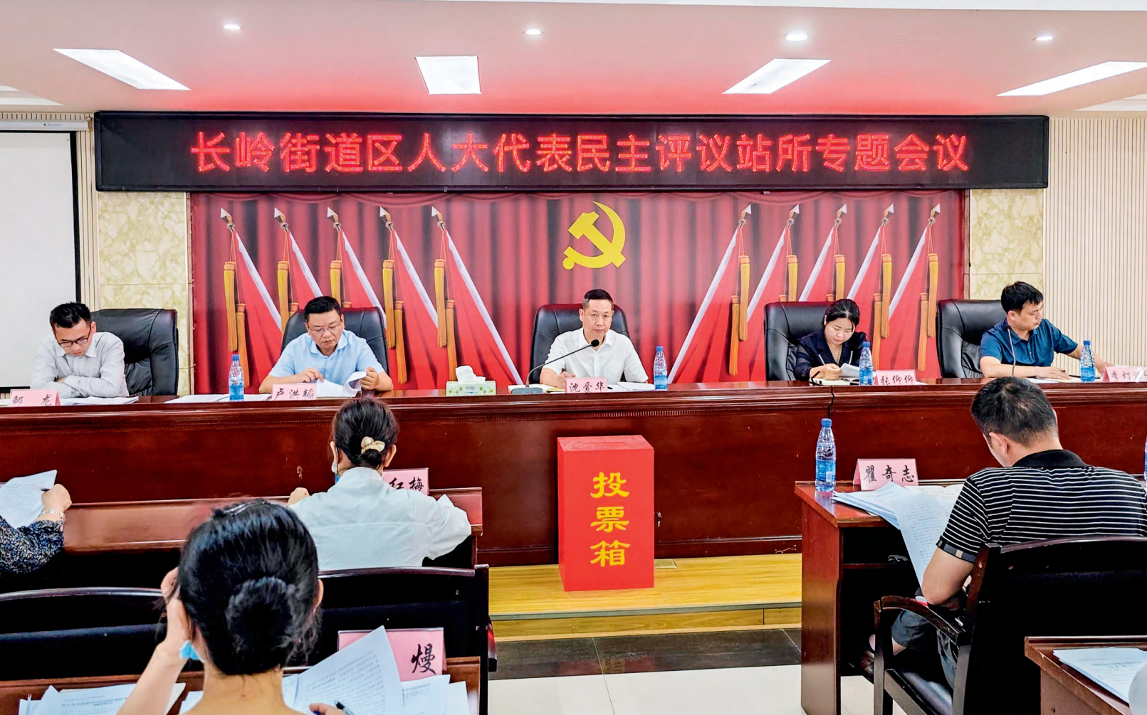
5月25日，岳阳市云溪区长岭街道人大工委组织区人大代表对长岭街道政务办公室等4个基层单位开展工作评议并进行满意度测评。