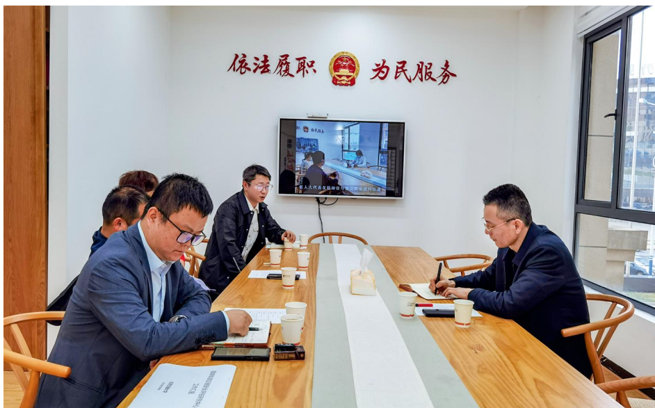
株洲市天元区人大代表在园区代表工作站接待群众。