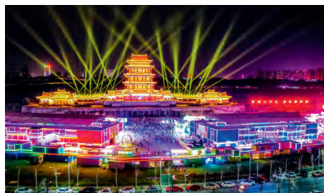
湘潭“万楼·青年码头”成为网红打卡地。

园区+综合服务”发展模式，湘潭高新区、湘潭经开区社会事务剥离移交到位。抢抓长株潭一体化重大机遇，兴隆湖片区首开区建设全面启动，长株潭轨道交通西环线一期工程通车运营。