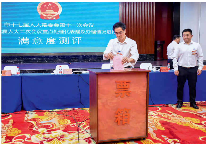
在邵阳市十七届人大常委会第十一次会议上，常委会组成人员对市十七届人大二次会议重点处理建议办理情况进行满意度测评。

邵阳市人大常委会坚持“内容高质量、办理高质量、结果高质量”的目标要求，不断提高代表建议质量，完善建议办理和督办工作机制，提升代表建议办理实效。