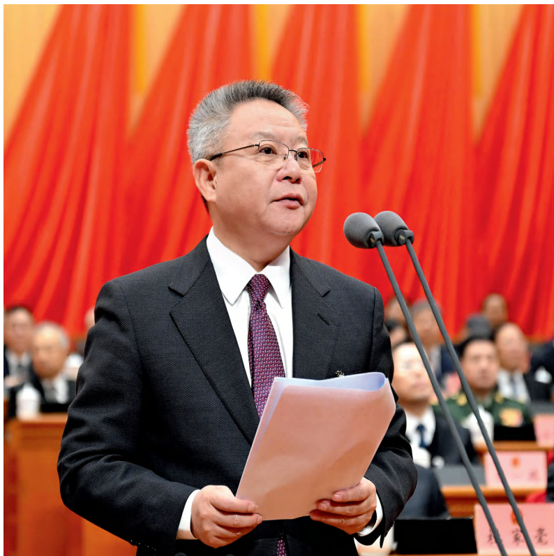
1月24日，湖南省十四届人大二次会议开幕，省委书记、大会主席团常务主席沈晓明主持开幕大会。