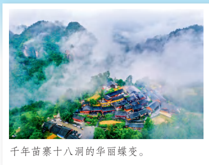
千年苗寨十八洞的华丽蝶变。