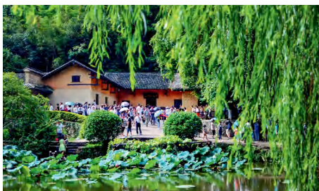
韶山毛泽东同志故居。