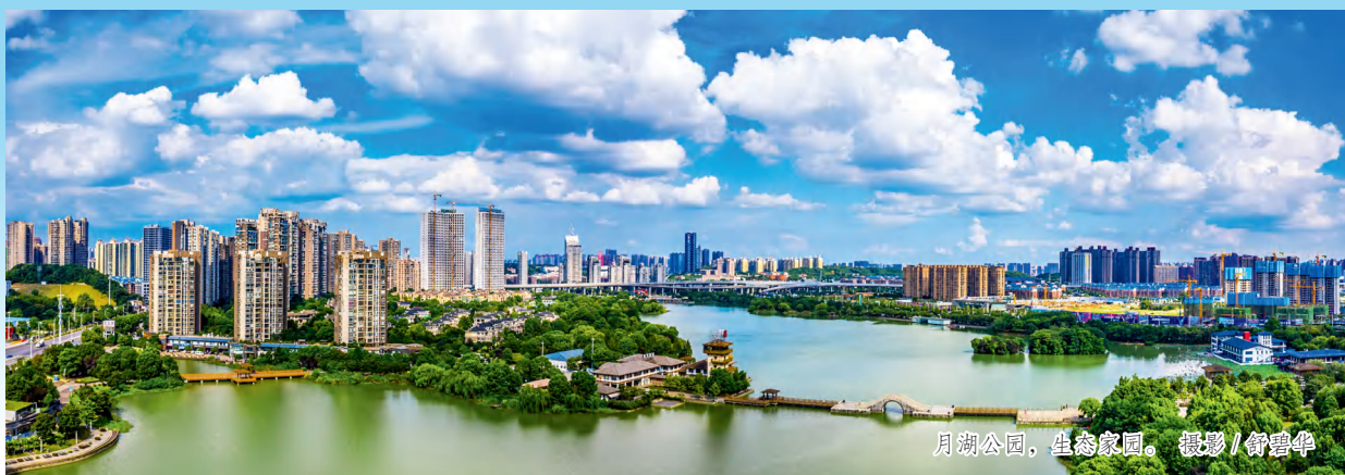
月湖公园，生态家园。