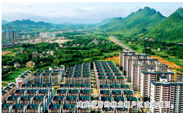
建成投用的林业棚户区改造项目。