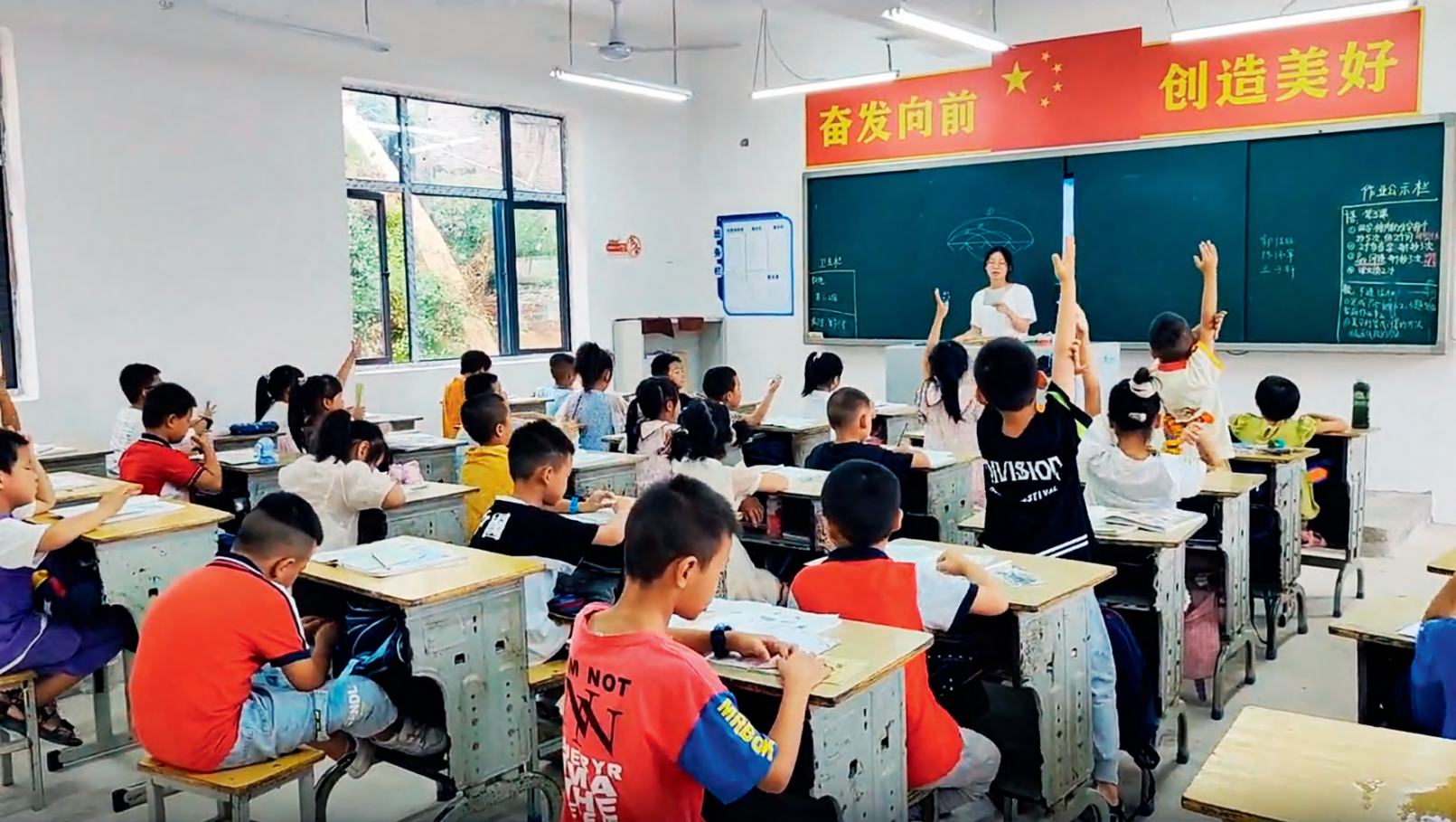
涟源市人大常委会依法监督，促进化解农村学校小班额，让更多小学生接受更加均衡、更加优质的教育。