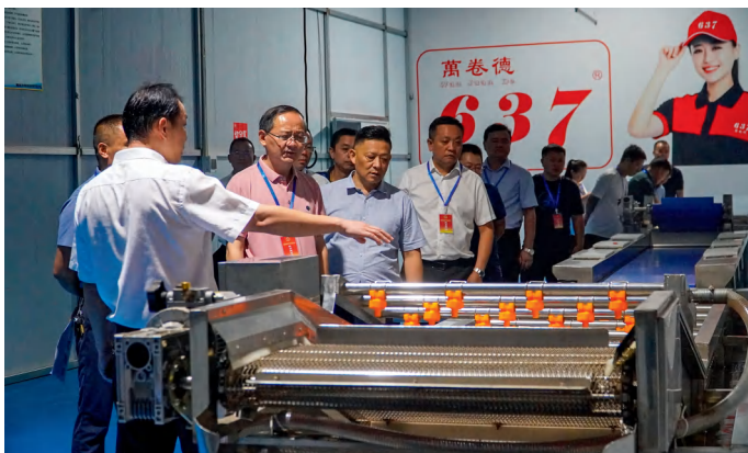
永定区人大常委会调研组就莓茶产业发展情况开展调研。

对于区人民政府副区长，主要从分管工作任务完成，领办重点处理代表建议，个人政治品质、道德品行、履职能力、工作态度以及党风廉政、作风建设等方面进行履职测评，测评结果按百分制核算得分。区人民政府组成部门主要负责人则采取“6+2”的模式进行履职测评，即6个共性履职和2个个性履职情况，测评包