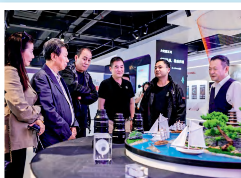
国家电影局副局长及国内演艺界友人前来公司调研。

展望未来，公司正在向着人工智能解决方案与技术服务提供商的方向努力，加强人工智能规划，致力打造成为全球机器视觉核心组件的核心制造商和工业镜头巨匠。