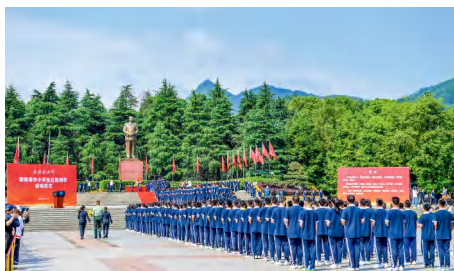
“我的韶山行”红色研学活动持续升温。