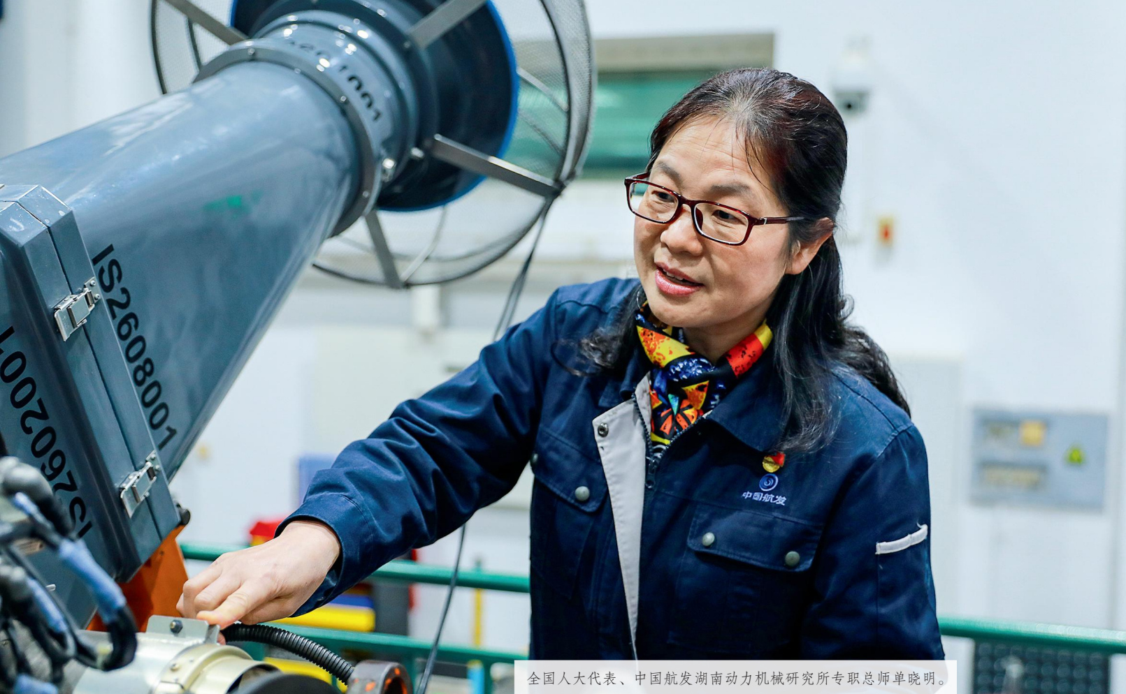
全国人大代表、中国航发湖南动力机械研究所专职总师单晓明。