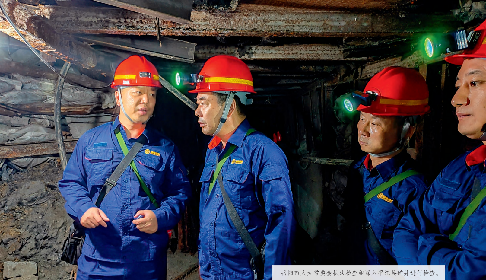
岳阳市人大常委会执法检查组深入平江县矿井进行检查。