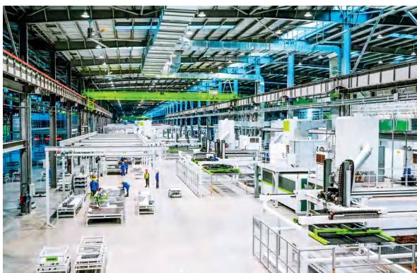
中联智慧产业城土方机械园区智能工厂。

2023年以来，在省委、省政府坚强领导下，省国资委党委坚持以习近平新时代中国特色社会主义思想为指导，深入学习贯彻党的二十大和二十届二中全会精神，全面落实省委十二届四次、五次全会精神，聚焦实现“三高四新”美好蓝图，坚持“稳进高新”工作方针，深化国有企业改革，加大科技创新力度，完善国资监管体系，防范化解重大风险，以高质量党建引领保障国企高质量发展，助力全省经济稳中向好、进中提质，为建设社会主义现代化新湖南作出积极贡献，赢得省委、省人大常委会、省政府主要领导充分肯定。