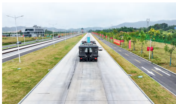
兴湘集团大飞机地面动力学试验平台车载实验装置。

着力强功能，争当服务国计民生的引领者。 始终牢记“国之大者”，指导督促国有企业围绕基础设施建设、乡村振兴、绿色发展等重点领域担当作为。机场集团加