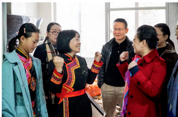
畲族妈妈的坚强和乐观感染了在场的每一个人。

2021年底的福建省宁德市畲族之行，对我而言是一次特别温暖的相遇。虽然只有短短两三天，但是那茶，那山和那人，都深深地铭记在我的记忆中。