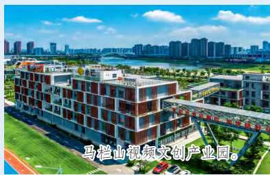
马栏山视频文创产业园。