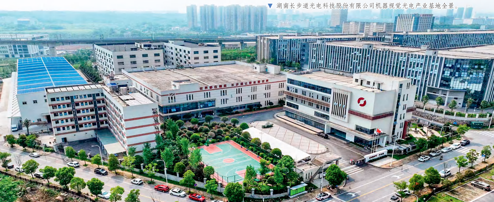
▼ 湖南长步道光电科技股份有限公司机器视觉光电产业基地全景。