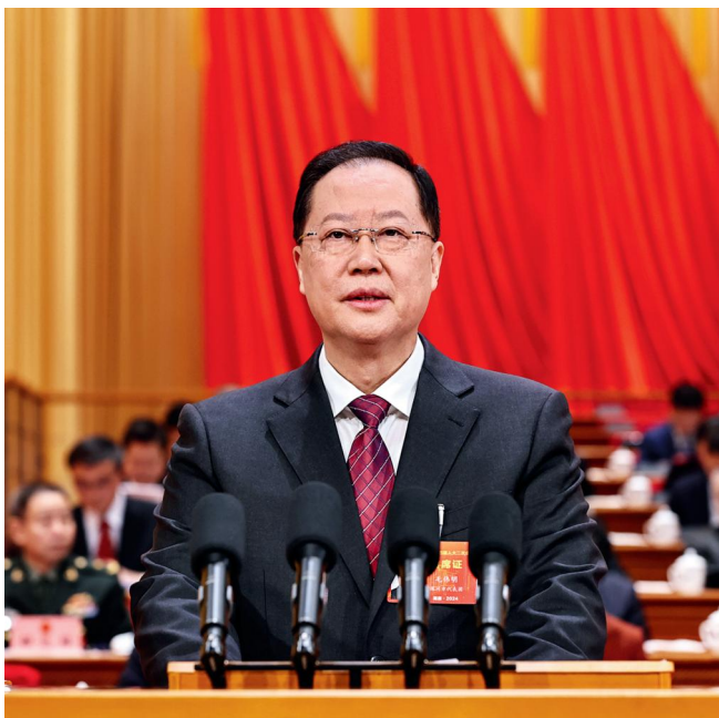
1月24日，湖南省十四届人大二次会议开幕，省长毛伟明作政府工作报告。