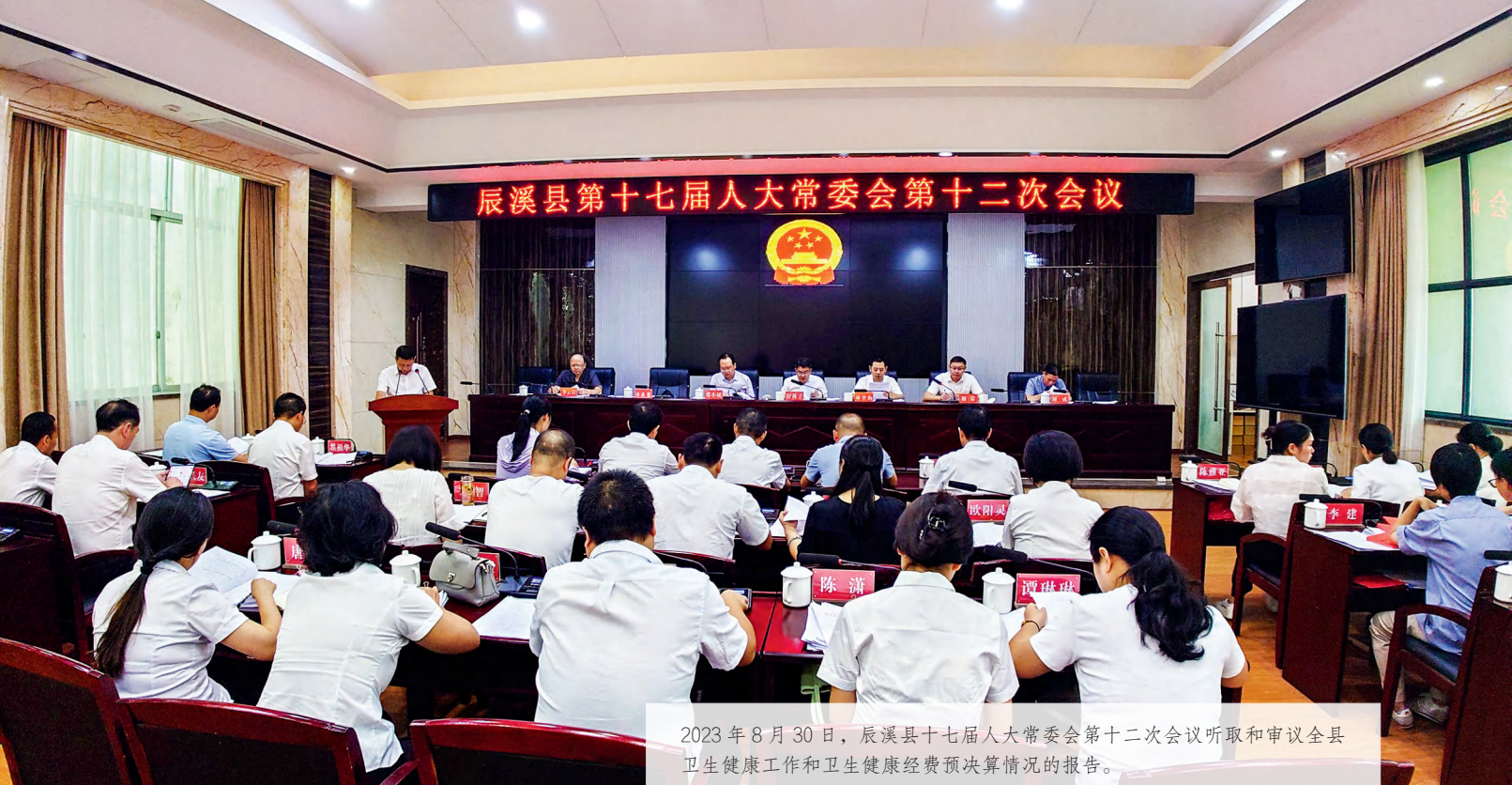
2023年8月30日，辰溪县十七届人大常委会第十二次会议听取和审议全县卫生健康工作和卫生健康经费预决算情况的报告。