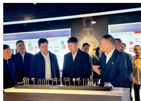
长沙市政府领导一行来公司调研。