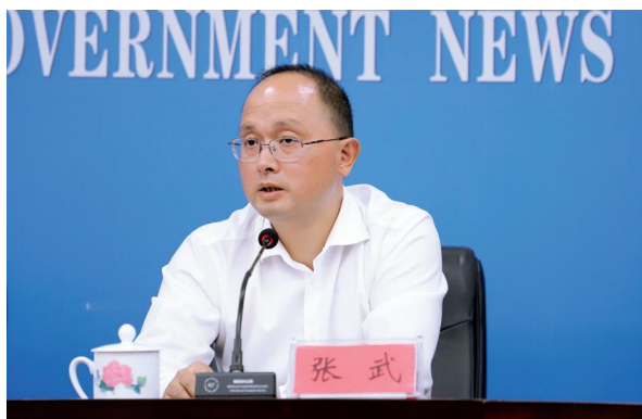
2023年10月，长沙市生态环境局党组书记、局长张武出席长沙市人民政府新闻发布会。

近年来，长沙市上下深入学习贯彻习近平生态文明思想，牢记习近平总书记“守护好一江碧水”殷殷嘱托，牢固树立生态优先、绿色发展的理念，锚定“三高四新”美好蓝图，持续深入打好污染防治攻坚战，全市生态环境质量持续改善。2023年，全市空气质量优良天数达321天，同比增加19天，优良率87.9%，同比上升5.7个百分点，PM 2.5 年均浓度38μg/m 3 ，PM 2.5 年均浓度和优良率均创历史最好成绩。2019年以来，全市国、省控断面水质优良率、达标率，县级及以上饮用水水源地水质达标率连续5年为100%。圭塘河成为全国唯一同时获得“‘两山’实践创新基地”和“美丽河湖”两项国家级生态殊荣的河流。全市重点