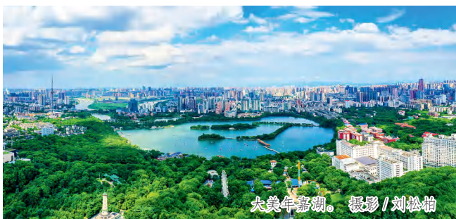
大美年嘉湖。

污水治理率 77.6%、中央土壤污染防治专项资金执行率 96.01%，实现“三个全省第一”。