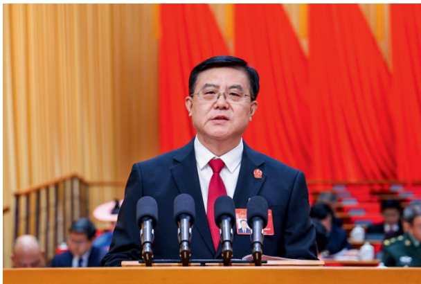
省高级人民法院院长朱玉作省高级人民法院工作报告。

司法是维护社会公平正义的最后一道防线，省“两院”工作报告用事实和数据说话，既彰显了法治力量，又释放了为民温度。