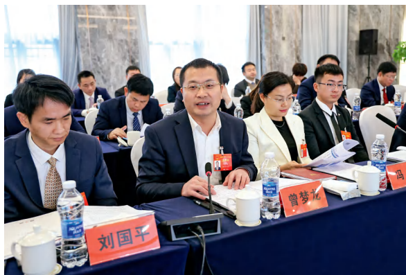
省人大代表审议省“两院”工作报告。

亮眼“成绩单”背后的奋进密码，是省“两院”为维护公平正义付出的不懈努力。1月27日上午，省