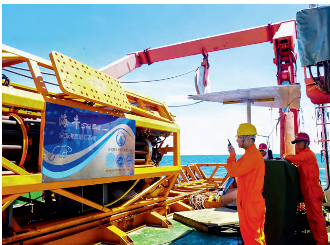
2021年4月，湖南科技大学领衔研发的我国首台“海牛II号”海底大孔深保压取芯钻机系统，在南海超2000米深水成功下钻231米。图为“海牛II号”准备开展深水钻探作业。

条例修订是列入省委常委会和省委全面依法治省委员会2023年度工作要点的重大立法项目，省人大常委会党组高度重视条例修订工作，常委会领导分别召开3场座谈会听取全国、省人大代表及高等学校、科研机构 and 科技型企业的意见；严格执行请示报告制度，在对条