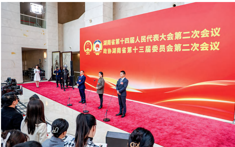
1月26日，湖南省十四届人大二次会议第二场“代表通道”集体采访。

“代表通道”让公众看到一个更加生动、立体、务实的人大会议，为湖南践行全过程人民民主注入了新的活力。