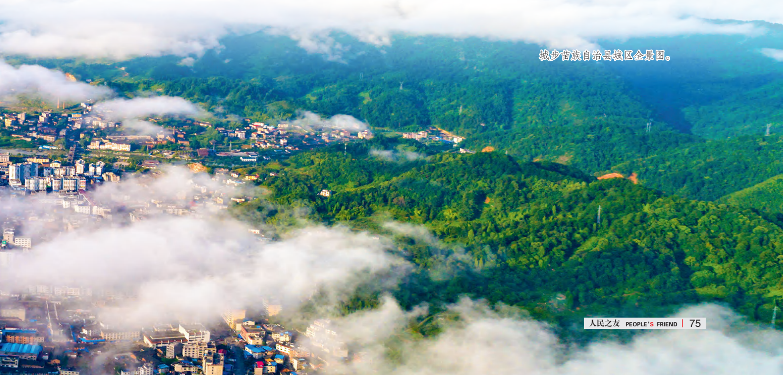
城步苗族自治县城区全景图。