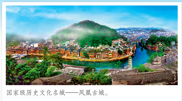
国家级历史文化名城——凤凰古城。

意识为主线，大力推进民族团结进步事业，湘西自治州再次获评“全国民族团结进步示范州”，成功申办第十三届全国少数民族传统体育运动会。