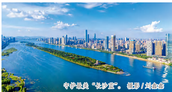
守护最美“长沙蓝”。