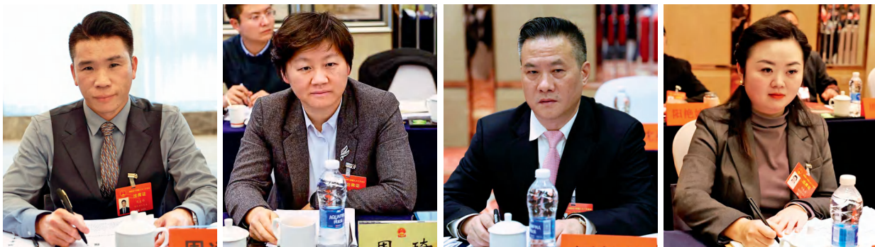
省人大代表认真审议计划、预算报告。

预算报告坚持积极财政政策适度加力、提质增效的总要求，支出安排聚焦落实“八大重点任务”、实施“八大行动”，着力保运转、保民生、保重点、守底线。