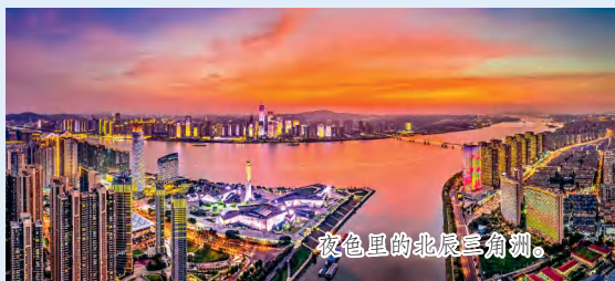
夜色里的北辰三角洲。