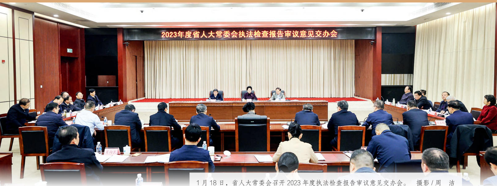
1月18日，省人大常委会召开2023年度执法检查报告审议意见交办会。