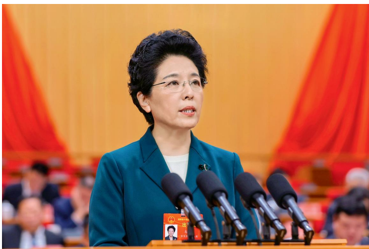
省人大常委会副主任乌兰在省十四届人大二次会议上作省人大常委会工作报告。

省十四届人大常委会坚持人大视角、法治思维，在履职元年取得了丰硕成果，展现了人民代表大会制度在湖南的生动实践，向党和人民交出了一份满意的答卷。