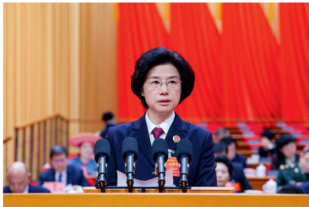
省人民检察院检察长叶晓颖作省人民检察院工作报告。

法安天下，德润人心。作为法治湖南建设的忠实践行者，省“两院”的工作一直备受社会各界关注。