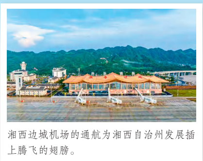
湘西边城机场的通航为湘西自治州发展插上腾飞的翅膀。