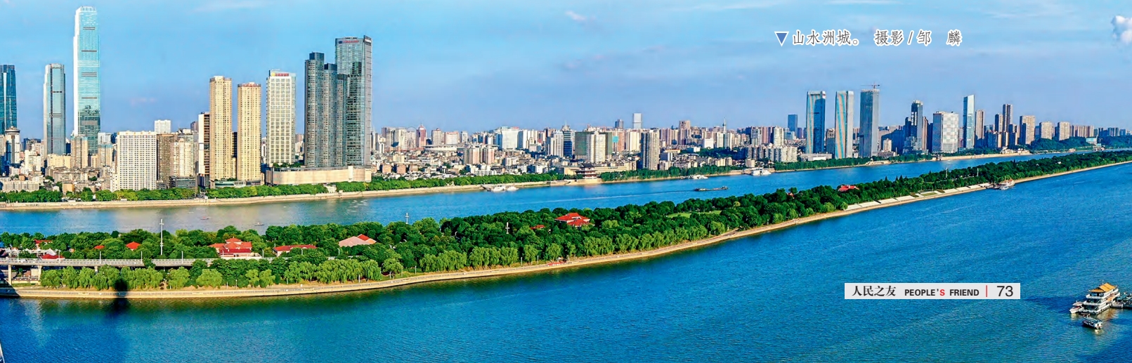
▽山水洲城。

今后，全市生态环境系统将持续深入打好污染防治攻坚战，守护好长沙蓝天白云碧水青山，奋力谱写人与自然和谐共生的现代化美丽长沙新篇章。