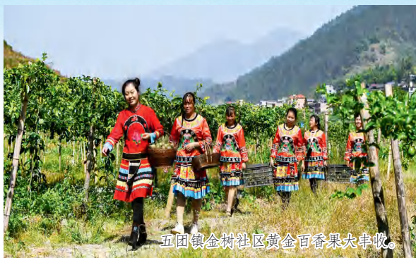
五团镇金树社区黄金百香果大丰收。

面向未来，全县上下将更加紧密地团结在以习近平同志为核心的党中央周围，在省委、省政府和邵阳市委、市政府的坚强领导下，努力保持全县经济社会高质量发展的良好势头，圆满完成各项目标任务，为全面实现“三高四新”美好蓝图，加快建设社会主义现代化新城步而团结奋斗。