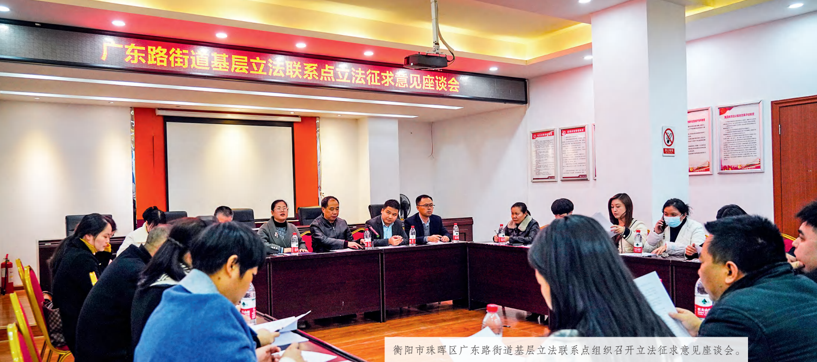
衡阳市珠晖区广东路街道基层立法联系点组织召开立法征求意见座谈会。