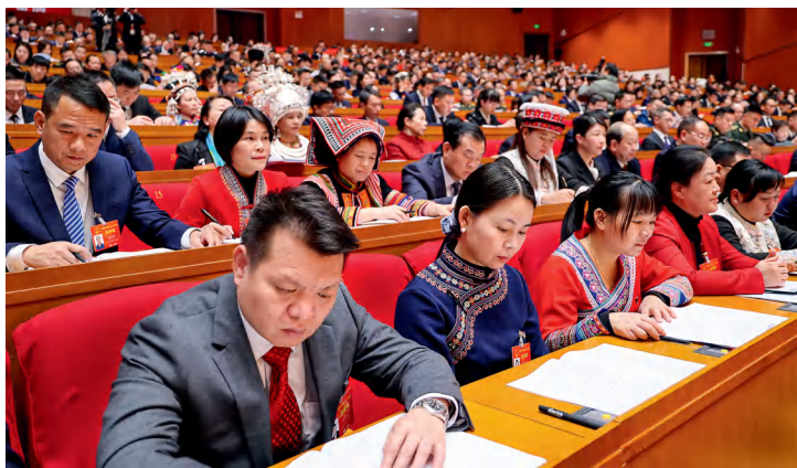
省人大代表认真听取政府工作报告。