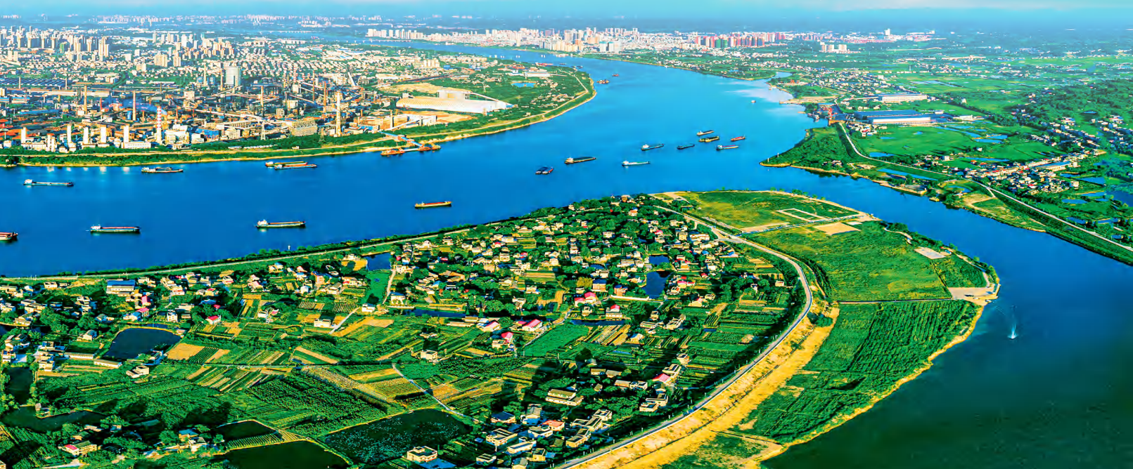
▼湘潭市城区全景图。

雄关漫道真如铁，而今迈步从头越。湘潭市将一手抓解放思想、一手抓贯彻落实，发扬“三牛”精神、落实“四敢”要求，朝着实现“三高四新”美好蓝图、加快建设“四区一地一圈一强”、全面建设社会主义现代化新湘潭目标奋勇前进。